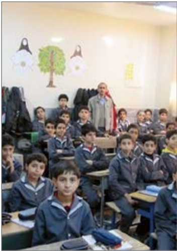
باسوادی در کشور را داشتیم که به بیش از ۹۳ درصد رسیده است.

محسن‌بیگی با بیان اینکه بر اساس سرشماری سال ۹۰، آمار بی‌سوادی استان ۲۰۲ هزار نفر بوده افزود: براساس آخرین سرشماری در سال ۹۵ بیشترین رشد