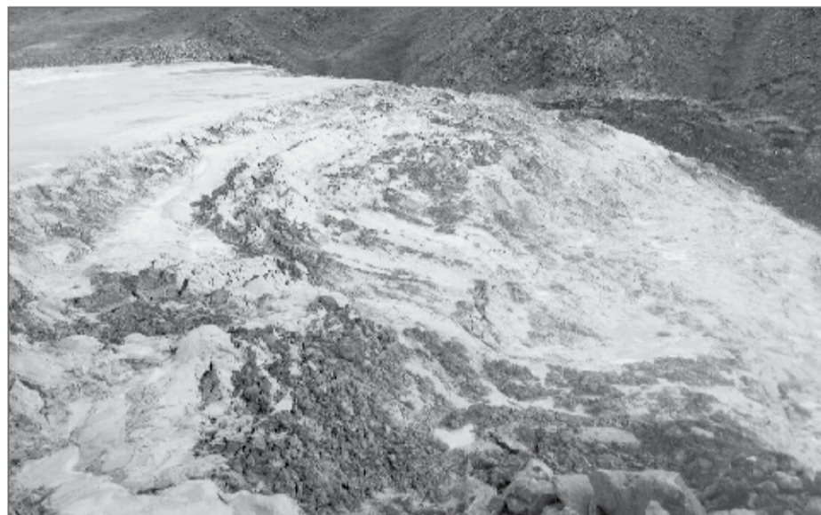
شکستن سد پسماند سرب در بلده مازندران موجب آلودگی محیط زیست شد

او درباره استفاده این کارخانه از سد پسماند برای دفع فاضلاب آغشته به سرب می‌گوید که حوضچه ترسیب یا سد باطله از جمله روش هایی است که کارخانه های معدنی برای دفع پسماند از آن استفاده می‌کنند. در این روش پسماند وارد حوضچه