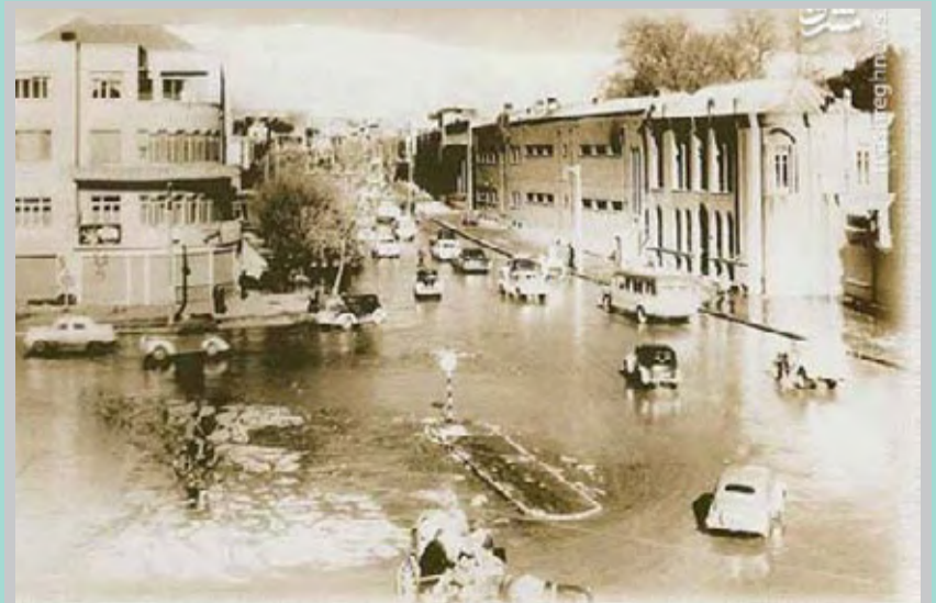
تصویری دیدنی از میدان بهارستان تهران را در سال ۱۳۲۶