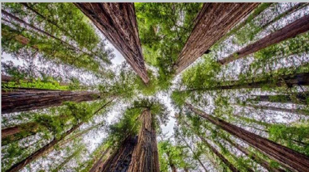
عکس نشنال جئوگرافیک نمایی زیبا از درختان سر به فلک کشیده را در شمال کالیفرنیا نشان می‌دهد.