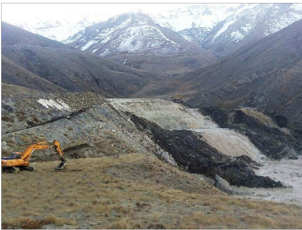
محیط زیست ایران

ساعت چهار صبح بود که سد خاکی پسماندهای کارخانه سرب ترکیب و میزان زیادی شیرابه های سربی که پشت آن بود به اراضی اطراف سررازی شد. این پسماندها علاوه بر آلوده کردن خاک، سفره های زیرزمینی آب، محصولات صیفی زمین های اطراف را نیز آلوده کرده است.