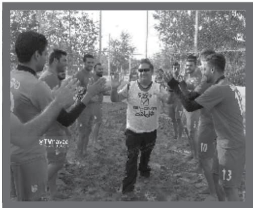
پیش از شروع تمرینات تیم ملی فوتبال ساحلی بازیکنان با ایجاد تونل به مارکو اوکتاویو خوش آمد گفتند

فوتبال پرسپولیس برای دستیابی به هدف خود برابر الهلال عربستان در بازی برگشت لیگ قهرمانان نیاز به آمادگی بیش از ۹۰ درصدی چند عنصر اصلی تیمش دارد. ۱۱ مرد ابتدایی برانکو ایوانکوویچ برابر الهلال در بازی رفت در یکی از بدترین عملکردهای فصل خود نتوانستند تیم را از فروپاشی نجات دهند و در نهایت نتیجه شکست ۴ بر ۰ مقابل نماینده عربستان رقم خورد. الهلال عربستان تیمی با کیفیت که با حضوری متوالی در لیگ قهرمانان و همچنین موفقیت‌های نسبی در آن به تیمی قدرتمند در منطقه غرب آسیا تبدیل شده است، مسلماً حریفی سرسخت تلقی می‌شود که عبور از آن نیازمند این است که بازیکنان رقیب در بالاترین حد توانایی فنی و روحی خود قرار داشته باشند.