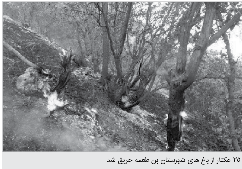
۲۵ هکتار از باغ‌های شهرستان بن طعمه حریق شد

طی سال‌های ۸۰ تا ۱۳۰۹ هزار و ۸۳۲ مورد حریق در عرصه‌های طبیعی ایران گزارش شده است