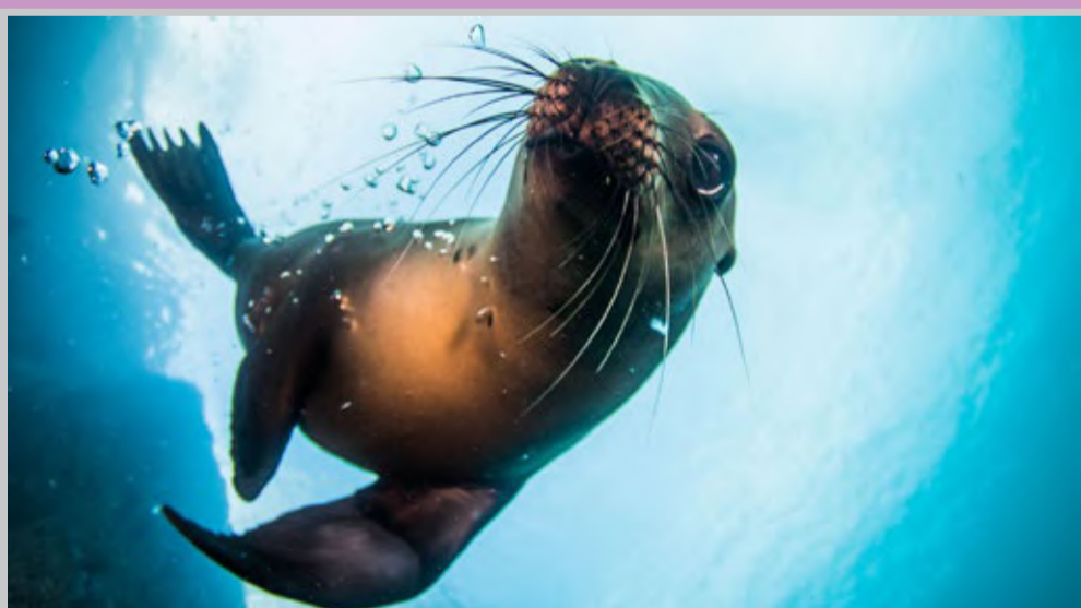
عکس روز نشنال جئوگرافی به این شیر دریایی اختصاص دارد که در حال بازی کردن با حباب های ایجاد شده در آب است.