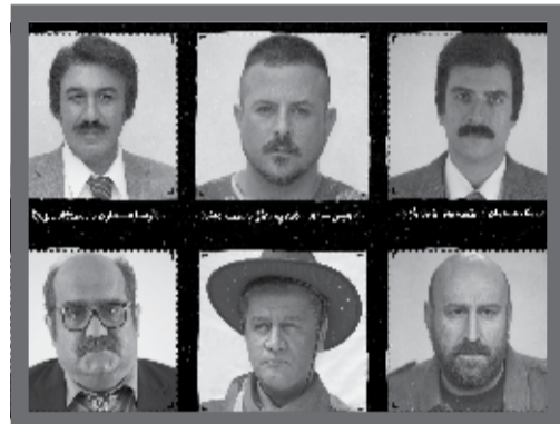
کمدی سینمایی «مصادره» به کارگردانی مهران احمدی کلید می‌خورد.

ورود پیدا کرده است. به گزارش خبرگزاری مهر، شبکه چهار سیما مدتی است ساخت برنامه‌ای در حوزه کتاب و کتابخوانی را در دستور کار خود قرار داده است و با برنامه «چارتکاب» تلاش می‌کند تا حس و حال خوب کتابخوانی را با مخاطبانش به اشتراک بگذارد و همه اقشار جامعه را به مطالعه تشویق کند.