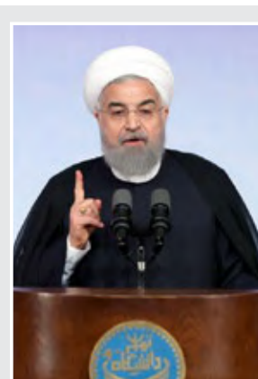
روحانی درخواست کرد

پایان تنبیه کسانی که مردم را به حضور تشویق کردند