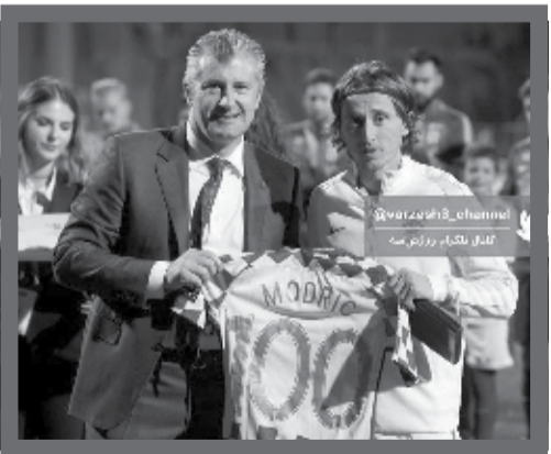
لوکا مودریچ که صدمین بازی ملی خود را برای کرواسی انجام داد، از سوی داوور شوکر، مهاجم اسطوره‌ای کرواسی و رئیس فعلی فدراسیون فوتبال این کشور مورد تقدیر قرار گرفت