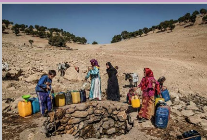
بی آبی در روستاهای کهگیلویه و بویراحمد