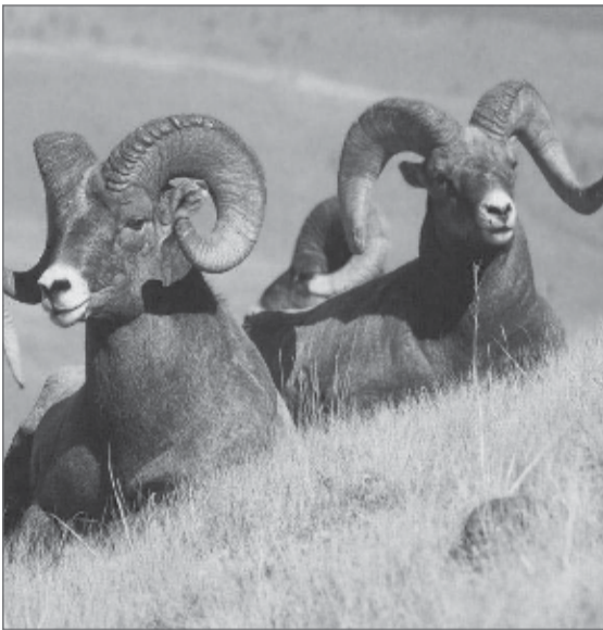
عسل: صدا و سیما

کمتر از ۱۲۰ هزار نشخوارکننده در کشور داریم