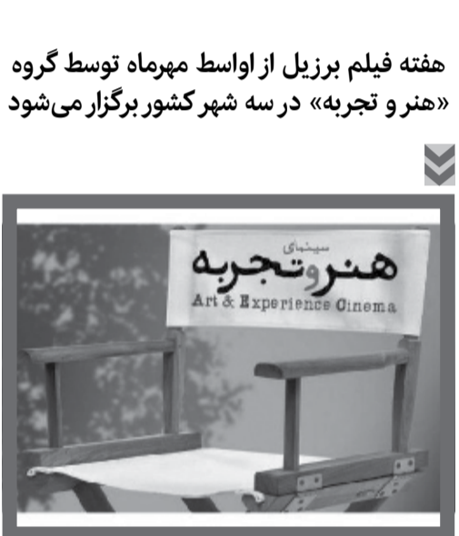
هفته فیلم برزیل از اواسط مهرماه توسط گروه «هنر و تجربه» در سه شهر کشور برگزار می شود