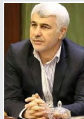
سخنگوی کمیسیون شوراهاى مجلس: