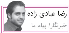
رضا عبادی زاده خبرنگار / پیام ما

ایزوگام سقف مسجد جامع اردستان، کندن آجرهای قدیمی مسجد جامع زواره و جایگزینی با آجرهای جدید و کاشی کاری دیوار خانه حسینی یزد خبرهای بدی بودند که در روزهای گذشته منتشر شدند