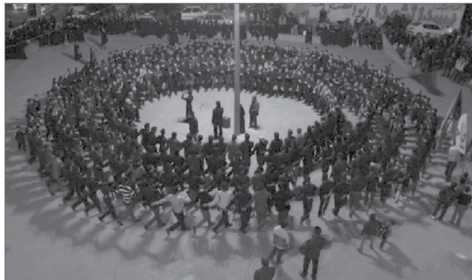
در سال ۹۵ از تمبر پستی آیین جوش زنی هرمزآباد رونمایی شد

وی با اشاره به معنای جوش زنی، افزود: جوش زنی برآمدن جوش از دل ما است. حلقه ای تشکیل شده و دستها به کمر یکدیگر به