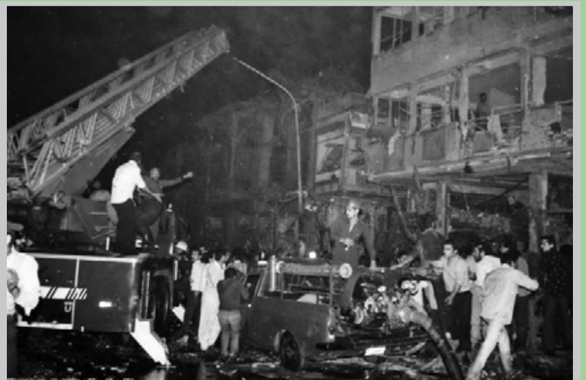
نهم مهر ۱۳۶۱ - انفجار بمب در میدان امام خمینی تهران