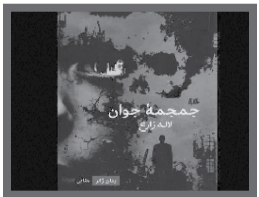
رمان جنایی «جمجمه جوان» نوشته لاله زارع توسط انتشارات هیلا منتشر و راهی بازار نشر شد