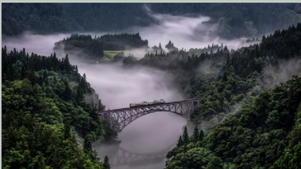
عکس روز نشنال جئوگرافی از خط تادامی است. این خط یک مسیر قطار است که در ۸۴ کیلومتری ژاین قرار دارد.