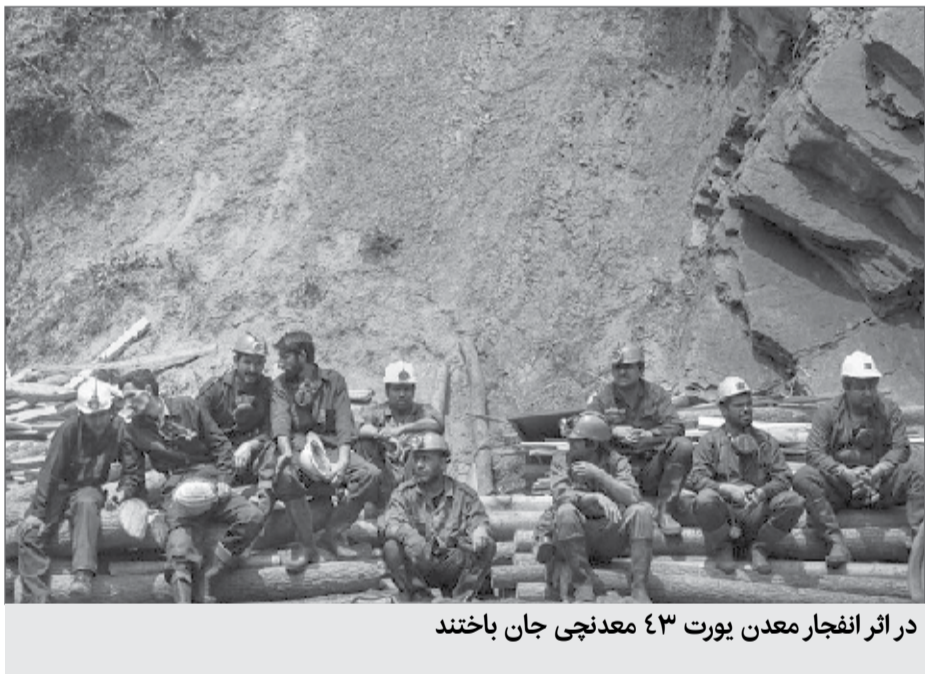
در اثر انفجار معدن یورت ۴۳ معدنچی جان باختند

مشکلات جان باختگان این حادثه بسیج شدند اما خانواده های این ۴۳ نفر هنوز با مشکلاتی دست و پنجه نرم می کنند. یکی از این مشکلات تهیه مسکن برای خانواده های جان باختگان این حادثه بود که با دستور وزیر راه و شهرسازی وقت قرار شد به مشکل بی مسکنی این خانواده ها پایان داده شود. طبق این دستور یا یکی از واحدهای مسکن مهر آزادشهر در اختیار خانواده ها قرار می گرفت و یا ۵۰۰ میلیون ریال کمک هزینه خرید مسکن به خانواده هر یک از قربانیان این حادثه پرداخت می شد. حالا ۱۵۰ روز از آن حادثه می گذرد