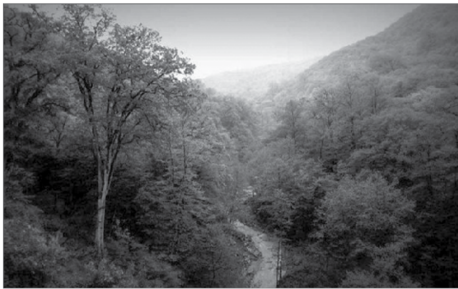
محققان می‌گویند کاهش حجم موجب شده جنگل‌ها منبع انتشار کربن شوند

در حالی این تحقیق از عملکرد برعکس جنگل‌ها در انتشار