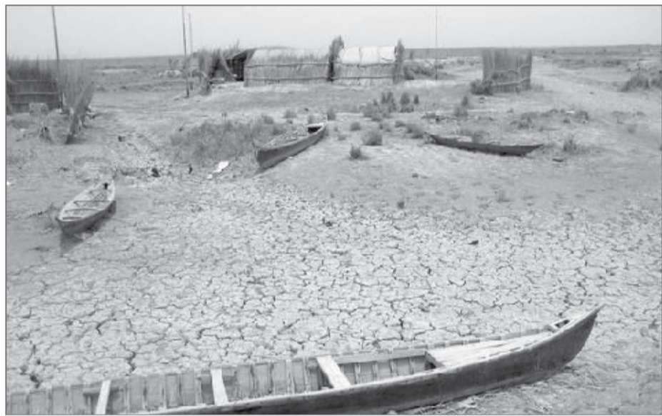
تالاب هورالعظیم یکی از اصلی ترین کانون های منشا گرد و غبار است

در آن خواستار گشودن دریچه های سدهای آناطولی جنوبی (بویژه سد آتاترک) و جلوگیری از ساخت و آبیگری سدهای در دست ساخت ترکیه (بویژه سد ایلیسو) شده اند. ترکیه قصد دارد در چارچوب طرح گاپ مجموعه‌ای از سد و نیروگاه برق‌آبی بر بخش بالایی رودخانه‌های دجله و فرات بسازد. نخستین سازه بزرگ این طرح، سد آتاترک بود که در سال ۱۹۹۲ تکمیل شد. سد ایلیسو نیز که برخی ساخت آن را به معنای "درگیر شدن تمامی استان‌های ایران با مشکل ریزگرگد" خوانده‌اند در قالب همین طرح قرار دارد. ساخت این سد بر روی سرشاخه‌های رودخانه دجله از سال ۲۰۰۶ آغاز شده و قرار است در سال ۲۰۱۹ تکمیل شود. چهار ماه پس از پویش #نجات_میانرودان، ۱۰۰ هزار نفر این نامه