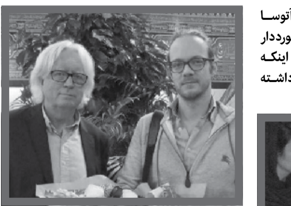
ورود پسر شفره به ایران

معرفی شود. یاران ویش بواش سرمربی سابق تاتهام انگلیس در حالی نتیجه این دیدار را واگذار کردند که در بازی رفت ودر خانه نتوانستند به نتیجه ای بهتر از تساوی یک بر یک دست پیدا کنند. بدین ترتیب نماینده ژاپنی حاضر در مرحله نیمه نهایی موفق شد راهی بازی پایانی لیگ قهرمانان آسیا ۲۰۱۷ شود و باید برای رسیدن به عنوان قهرمانی از سد الهلالی ها بگذرد. دیدار رفت بازی پایانی روز شنبه، ۲۷ آبان ماه در ریاض عربستان برگزار می شود و آخرین بازی لیگ قهرمانان یعنی دیدار برگشت فینال نیز روز شنبه ۴ آذر ماه در ژاپن به انجام می رسد.