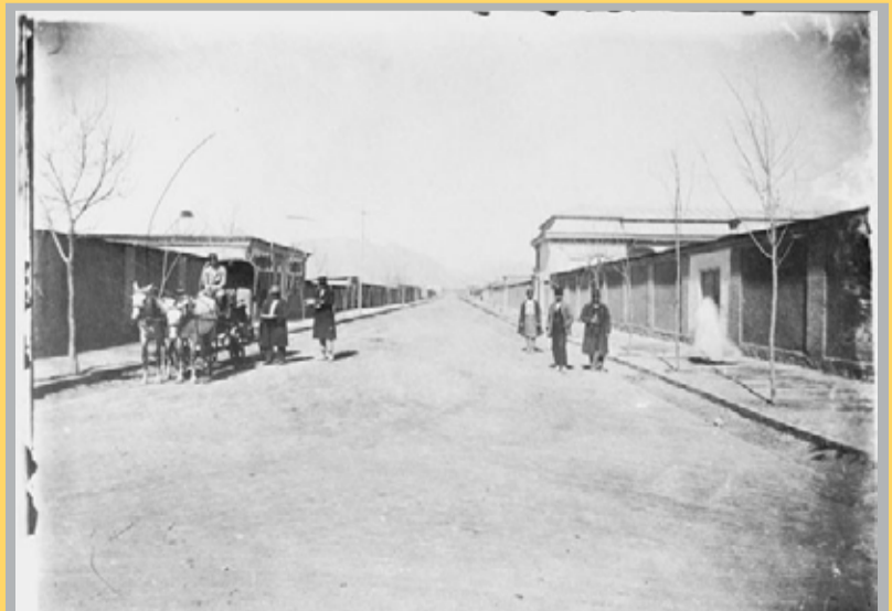
● خیابان منوچهری شیراز سال ۱۳۱۰ از سری عکسهای میرزا فتح الله چهره نگار