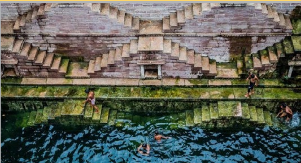
● عکس نشنال جئوگرافیک کودکانی را که در حال شنا در شهر جوداپور ایالت راجستان هند هستند نشان می‌دهد.