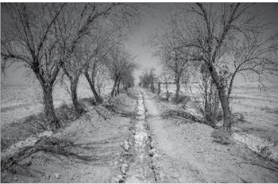
۹۵ درصد مساحت اصفهان تحت تاثیر خشکسالی است

زندگی می‌کنند. وی با اشاره به اینکه طی سه ماهه آینده پیش بینی‌ها از بهبود شرایط بارشی در پاییز سال ۹۶ نسبت به ۹۵ خبر می‌دهد، گفت: اما نسبت به بلند مدت با کاهش ۱۵ درصدی بارش‌ها روبرو خواهیم بود. بارش‌های پاییزی از اواسط آبان ماه آغاز می‌شود، اما متأسفانه از نظر جاری، نوع میزان بارش و پراکنش به خصوص پراکنش مکانی و زمانی بارش‌های مساعدی نیست. مدیر کل هواشناسی استان اصفهان تصریح کرد: دمای هوا در پاییز در نواحی شرقی و مرکزی استان از میانگین بلند مدت اندکی پایین‌تر بوده و در واقع پاییزی خنک‌تر را شاهد خواهیم بود. بیجندی اظهار کرد: پیش بینی‌ها نشان می‌دهد در