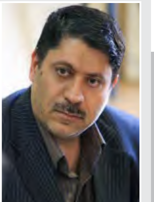
فرمانده جهاد سازندگی کرمان در دفاع مقدس: جهاد سازندگی از ارکان مدیریت جنگ بود