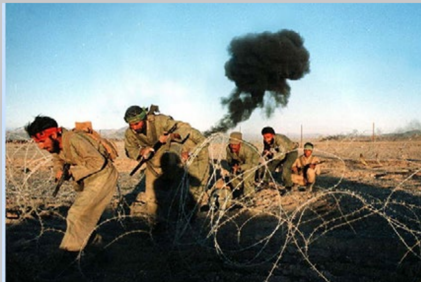
عکسی از دوران جنگ ایران و عراق