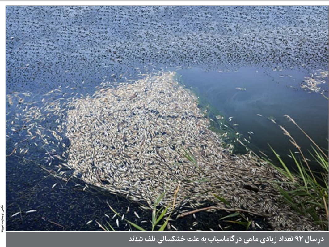
در سال ۹۲ تعداد زیادی ماهی در گاماسیاب به علت خشکسالی تلف شدند

در این پیام ما می‌خوانید شکار چیان، محیط بان ساوه‌ای را با خودرو زیر گرفتند فارس خبر داد که عصر جمعه شکارچیان متخلف در بخش نوبران ساوه، با یک خودروی پراید، محیط‌بانی که به آنها دستور ایست داده بود را عمداً زیر گرفته و از محل متواری شدند. کاهش ۳۳ تا ۳۶ درصدی بارش در خزر و ارومیه بررسی میزان بارندگی در ۶ حوضه اصلی آبریز کشور نشان می‌دهد حوضه های آبریز دریاچه ارومیه و خزر افت بارش چشمگیری داشته اند.