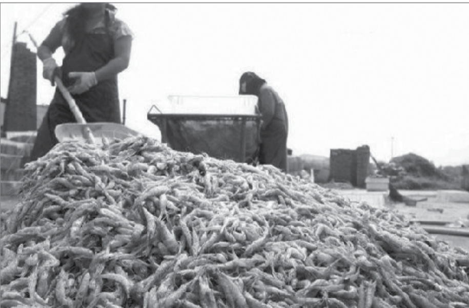
به گفته یکی از پرورش دهندگان ۷۰ استخر تلفات داشته اند

برای ششمین سال باز هم مرگ و میر به سراغ مزارع پرورش میگوی چابهار آمد؛ مرگ و میری که چهار دلیل متفاوت از بیماری «ویبریو»، «کمبود اکسیژن و رشد جلبک»، «غذای نامناسب و گرسنه ماندن میگوها» تا «بیماری کهن لکه سفید» برای آن مطرح می شود و دیگر تناقض قابل توجه در این میان، میزان درگیری مزارع و استخرهاست که از سوی مسوولان دو - سه استخر و از سوی پرورش دهندگان بیش از ۷۰ استخر عنوان می شود! آن طور ایسنا نوشته طی ماه گذشته تلفاتی در مزارع پرورشی