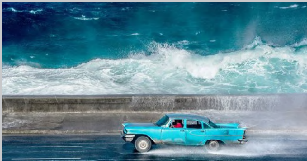
عکس نشنال جئوگرافیک عبور یک ماشین قدیمی را با وجود موج های خروشان از کنار بلوار مالکون در شهر هاوانا نشان می دهد.