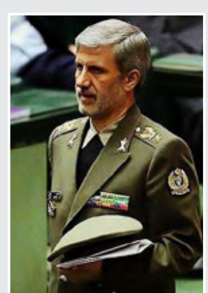
وزیر دفاع: برای تولید تسلیحات موشکی اجازه نمی‌گیریم