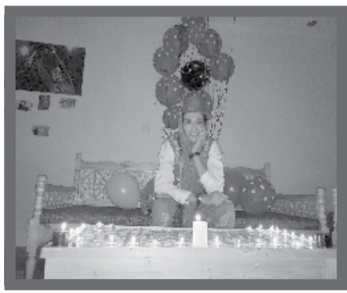
جشن تولد ۲۶ سالگی الهه منصوریان، قهرمان ووشو جهان