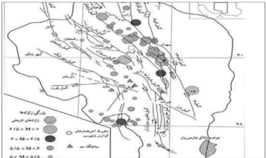
۹۸ درصد مناطق مسکونی استان زلزله خیز است

هر ساله تعدادی زیادی از کارگران معادن به دلایلی از جمله انفجار، حفاری های غیر اصولی جان خود را از دسته