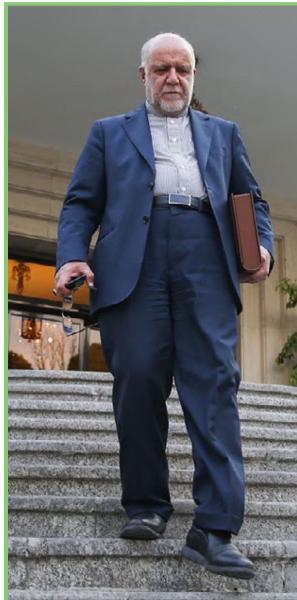
نخستین جلسه هیات دولت دوازدهم