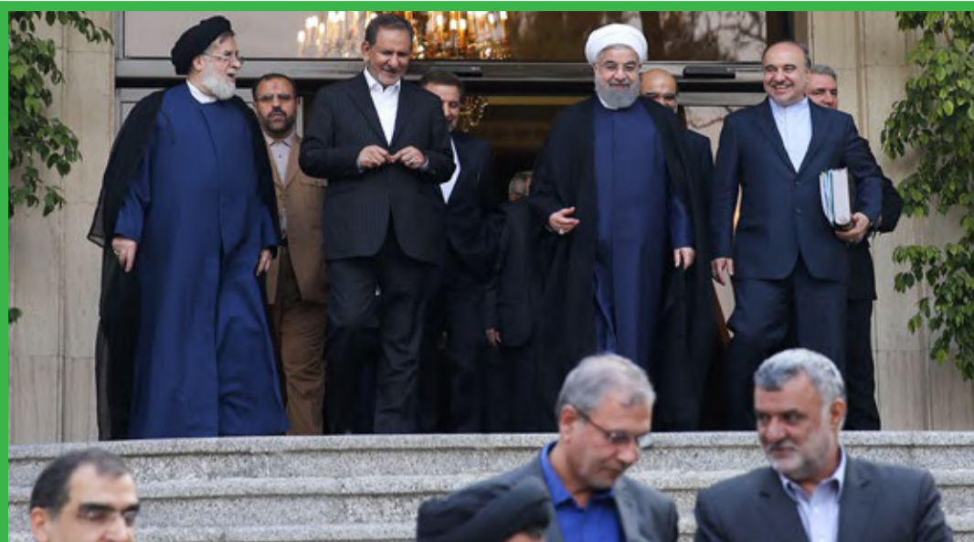
نخستین جلسه هیات دولت دوازدهم