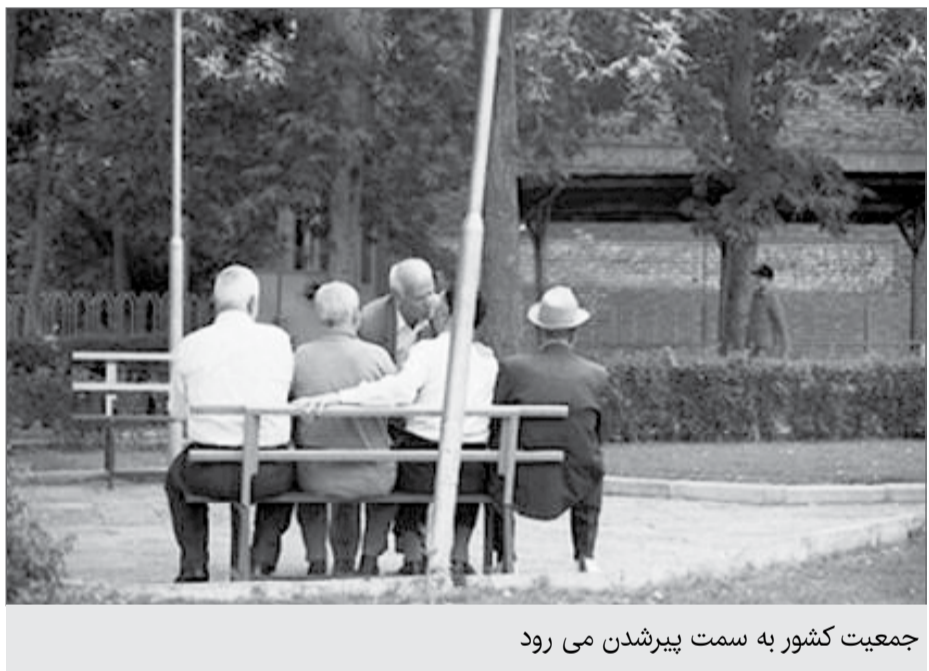
جمعیت کشور به سمت پیرشدن می رود

به ترتیب با میانگین سنی ۲۳/۵، ۲۷/۱ و ۲۸/۶ سه استان جوان کشور هستند و از طرفی سه استان گیلان، مازندران و تهران به ترتیب با میانگین سنی ۳۵/۵، ۳۴ و ۳۳/۲ با پیرترین استان‌های کشور هستند. آنطور که دنیای اقتصاد نوشته استان سیستان و بلوچستان، هرمزگان و کهگیلویه و بویراحمد به واسطه مسائلی همچون سطح بالای محرومیت (محرومیت‌های شغلی، بهداشتی، آموزشی، درمانی و...) و همچنین نامساعد بودن شرایط آب و هوایی جزو استان‌های مهاجر فرست محسوب می‌شوند و همین موضوع یکی از عواملی است که منجر به پایین بودن میانگین سنی در این استان‌ها شده است، البته نرخ زاد و ولد در این استان‌ها