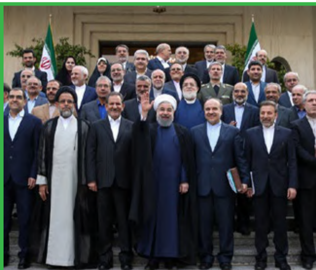
نخستین جلسه هیات دولت دوازدهم