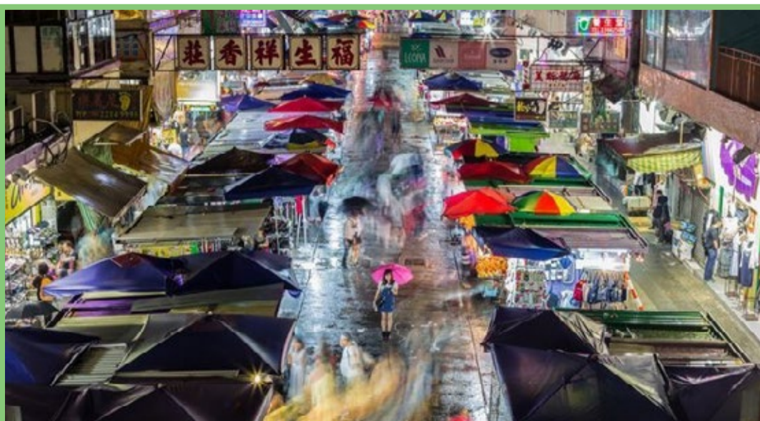
عکس روز دوشنبه نشانال جئوگرافیک به خیابان باغ هنگ کنگ اختصاص داشت.