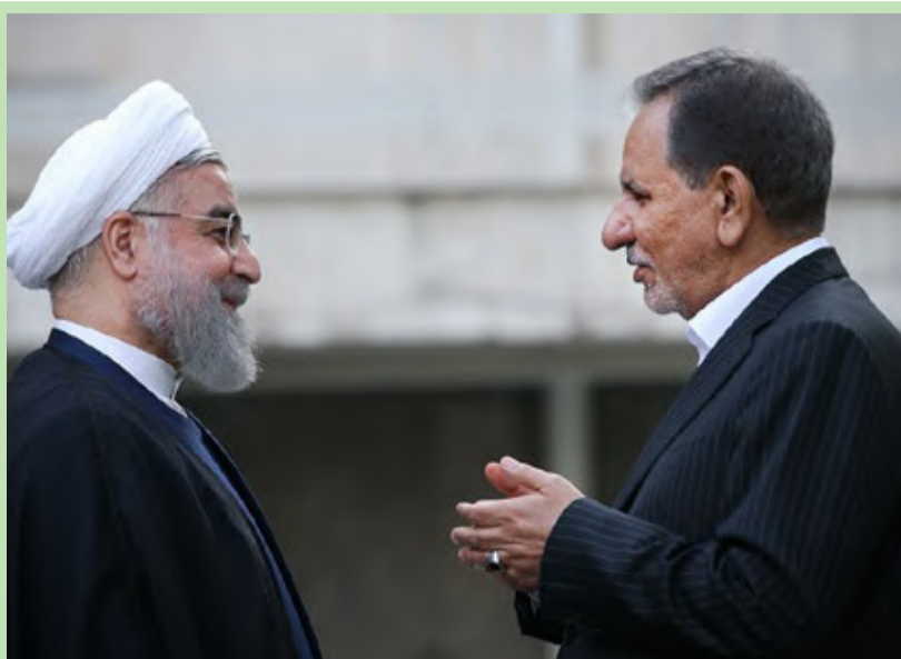
نخستین جلسه هیات دولت دوازدهم