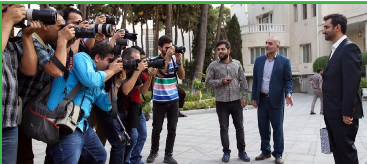
نخستین جلسه هیات دولت دوازدهم