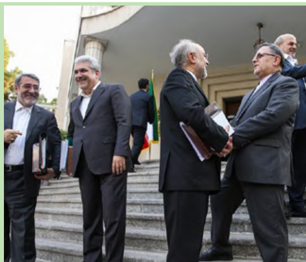
نخستین جلسه هیات دولت دوازدهم