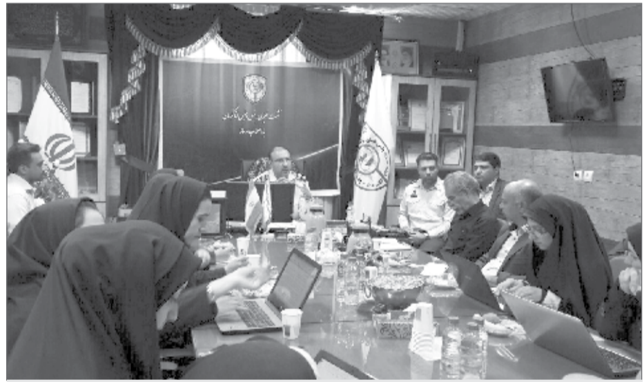
نشست خبری رییس پلیس فتای استان کرمان با اصحاب رسانه

افزایش آگاهی افراد درباره آسیب های فضای مجازی و اعتماد نکردن به افراد ناشناس در این فضا موجب کاهش آسیب این جرایم می شود. وی تصریح کرد که برداشت های غیرمجاز اینترنتی با ۲۷ درصد، مزاحمت های اینترنتی با ۱۶ درصد، کلاهبرداری های اینترنتی با ۱۵ درصد، هتک حیثیت و نشر اکاذیب با ۱۴ درصد و سایر جرایم با ۲۸ درصد بیشترین آمار جرایم فضای مجازی را به خود اختصاص داده اند. سرهنگ یادگارنژاد با تاکید به اینکه اولویت نخست جرایم مجازی برداشت های غیرمجاز اینترنتی است گفت که ۴۲ درصد مجموع جرایم مطرح شده در پلیس فتا مربوط به مسائل اقتصادی است که نسبت به مدت مشابه سال قبل ۶ درصد کاهش داشته