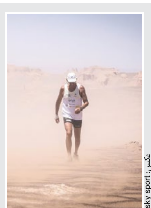
دو تنده رکورددار گینس: می خواستم دویدن در گرم ترین نقطه جهان را تجربه کنم