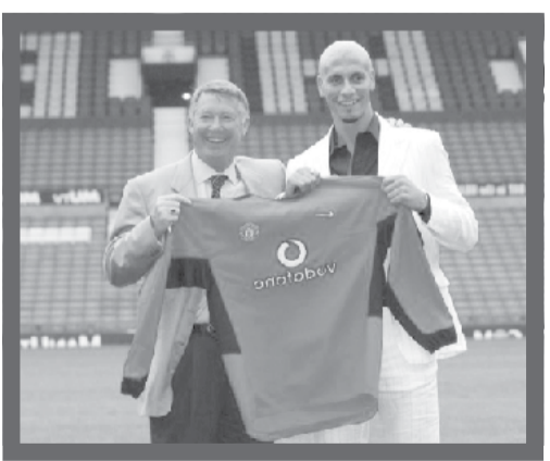
درچنین روزی در سال ۲۰۰۲ باشگاه منچستریونایتد با مبلغ ۳۰ میلیون پوند ریو فردیناند را از لیدز یونایتد به خدمت گرفت.