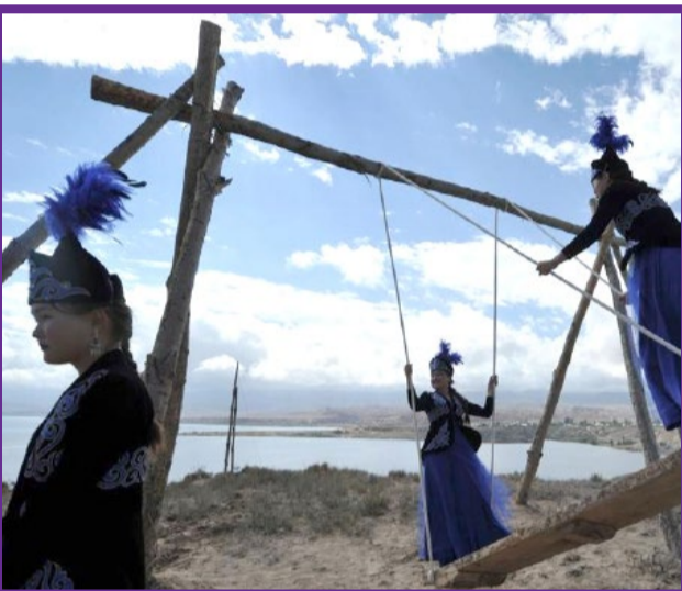
● جشنواره سنتی شکار چیان در قرقیزستان