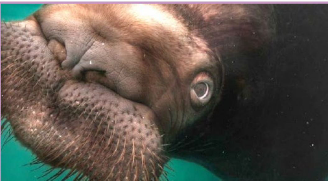
● عکس روز شنبه نشانال جئوگرافیک یک گراز دریایی سیبل دار را در آکواریومی در اوتاروی ژاپن نشان می دهد.