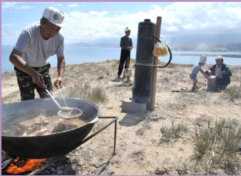
● جشنواره سنتی شکار چیان در قرقیزستان