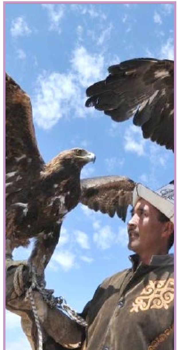
● جشنواره سنتی شکار چیان در قرقیزستان