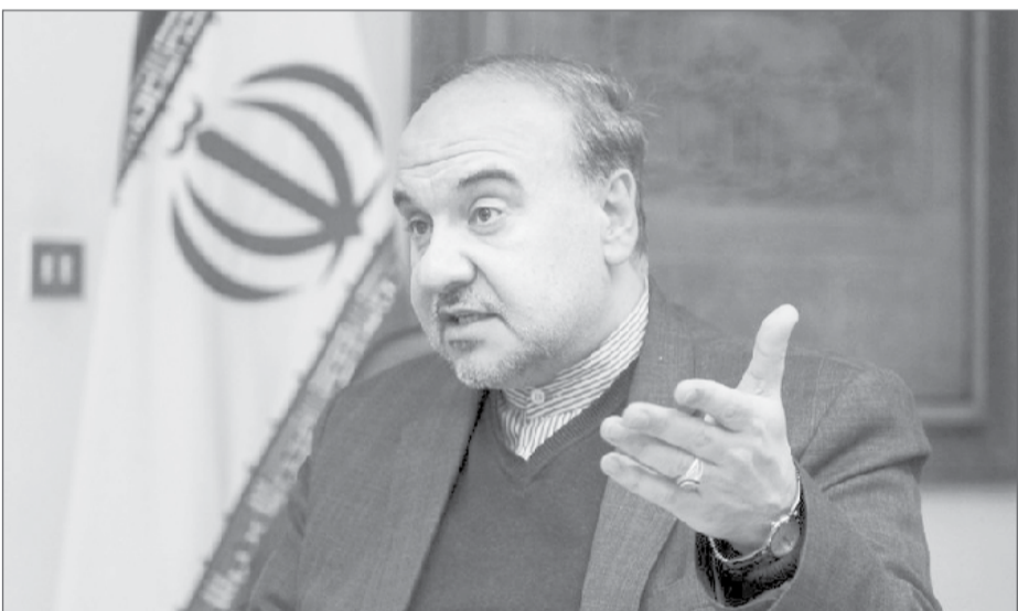
مسعود سلطانی فر وزیر ورزش و جوانان

گفت در این شهرستان هیچ سازمان و ارگانی سالن ورزشی ندارد. وزیر ورزش و جوانان با اشاره به صحبت نماینده مردم پنج شهرستان جنوبی استان کرمان مبنی بر این که سرانه ورزشی در جنوب کرمان چهار سانی متر است بیان کرد: در هر شهرستان علاوه بر مکانهای ورزشی در اختیار وزارت ورزش و جوانان است اداراتی مانند آموزش پرورش، نیروی انتظامی و... نیز فضای ورزشی دارند که اگر این مکانها را نیز جز سرانه فضای ورزشی حساب کنیم قطعاً آمارها زیادتر می شود. مسعود سلطانی فر در جلسه شورای اداری کرمان با اشاره به انتقاد به برخی نمایندگان مبنی بر عدم تکمیل پروژههای عمرانی ورزشی در برخی شهرستانها گفت: در کل کشور حدود چهار هزار پروژه نیمه تمام داریم که برای تکمیل این واحدها به اعتباری