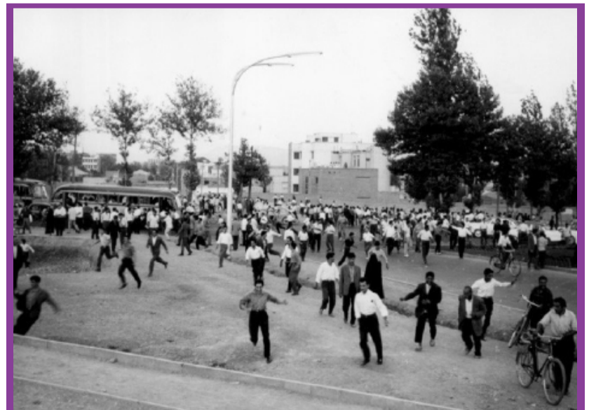
● روزی که مردم برای بازگشت مصدق به نخست وزیری قیام کردند