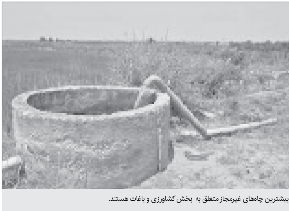
بیشترین چاه های غیرمجاز متعلق به بخش کشاورزی و باغات هستند.

اینهاست. آن طور که شرق نوشته است وی اعلام کرد آمار ۱۰۰ هزار حلقه مربوط به آنهایی است که آمده اند فرم پر کرده اند؛ وی ادامه داد «من مطمئن نیستم که تعداد چاه های دیگری هم وجود دارند و فرم پر نکرده اند.» قائم مقام وزیر نیرو تاکید کرد که مهم نیست چند هزار چاه غیر مجاز در کشور وجود دارد مهم این نکته است که بیلان آب زیر زمینی کشور نشان می دهد که در سال چیزی حدود هشت تا ۱۰ میلیارد متر مکعب برداشت بیش از حد مجاز انجام می شود وی در مقایسه با بخش صنعت و مصارف خانگی، بیشترین چاه های غیر مجاز را متعلق به بخش کشاورزی و باغات اعلام کرد و در ادامه گفت که در بخش صنایع، مصارف آب، تعریف روشنی دارند، برای نمونه حداکثر میزان آبی که کل صنایع کشور مصرف می کنند، حول و حوش دو میلیارد مترمکعب است؛ گذشته