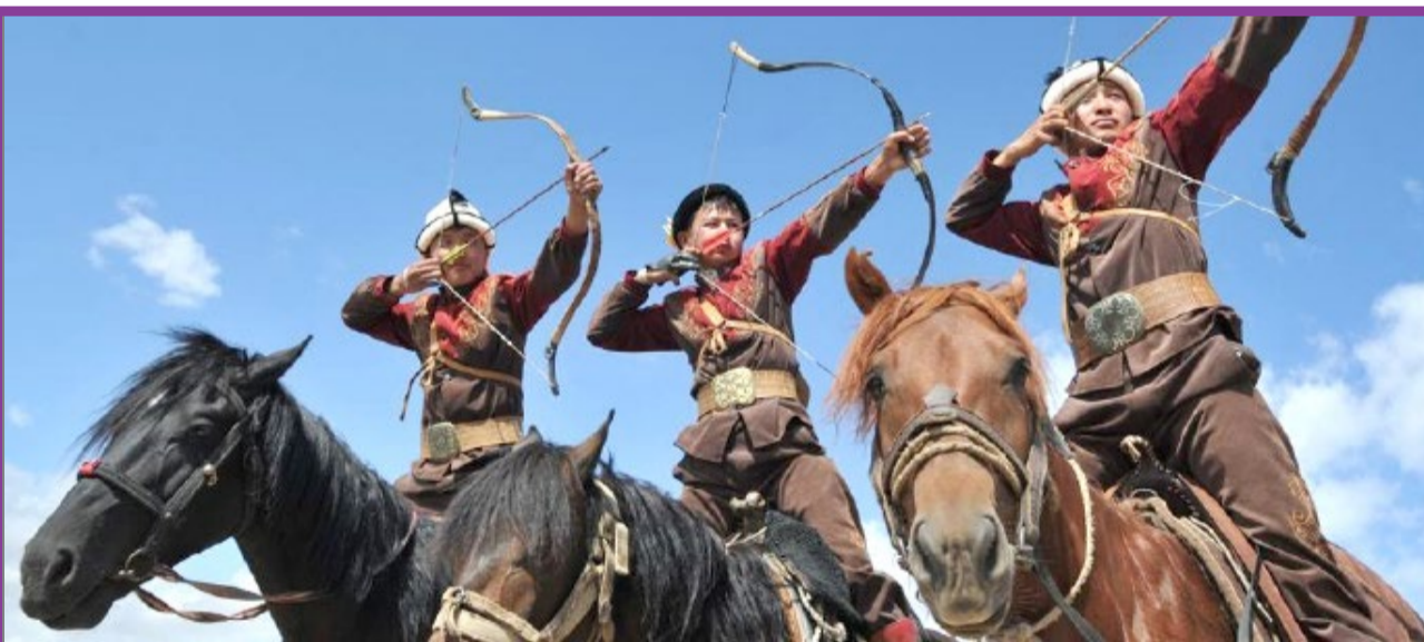
● جشنواره سنتی شکار چیان در قرقیزستان