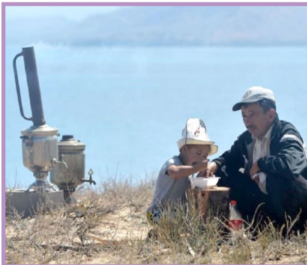
● جشنواره سنتی شکار چیان در قرقیزستان