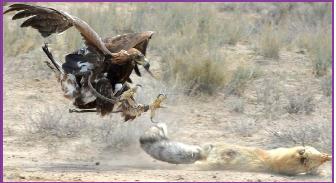
● جشنواره سنتی شکار چیان در قرقیزستان