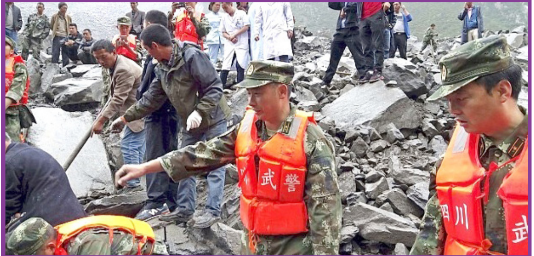
● بر اثر بارندگی و رانش زمین در مناطق جنوب غربی چین دستکم ۱۴۱ نفر زیر گل و لای دفن شده‌اند.