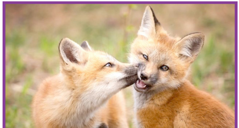
● تصویر زیبایی دو بچه روباه قرمز که در جزیره پرنس ادوارد (Prince Edward) در کانادا به همراه خانواده‌شان زندگی می‌کنند.