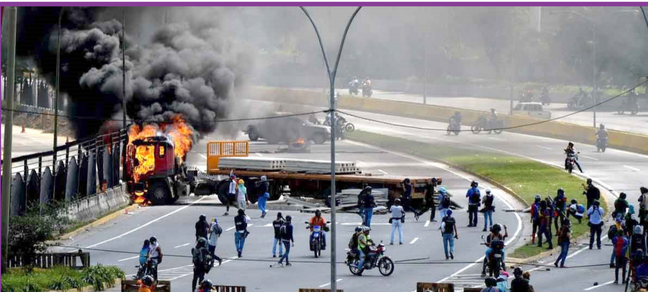
● اعتراض به بحران های اقتصادی در ونزوئلا