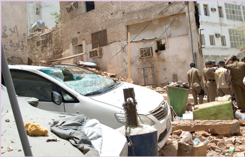
● بر اثر انفجار انتحاری در نزدیکی مسجد الحرام ۱۱ نفر مجروح شدند