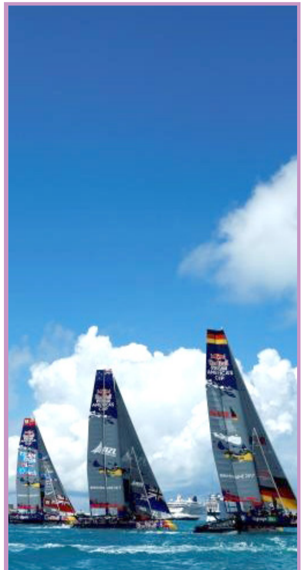
● سی و پنجمین دوره مسابقات قایق‌های بادبانی کاپ آمریکا