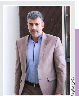
رییس «صمت» کرمان عنوان کرد

تعیین تکلیف وضعیت زغال سنگ، یکی از چالش های بزرگ استان