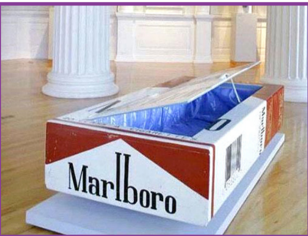
● تابوت جالب در غنا