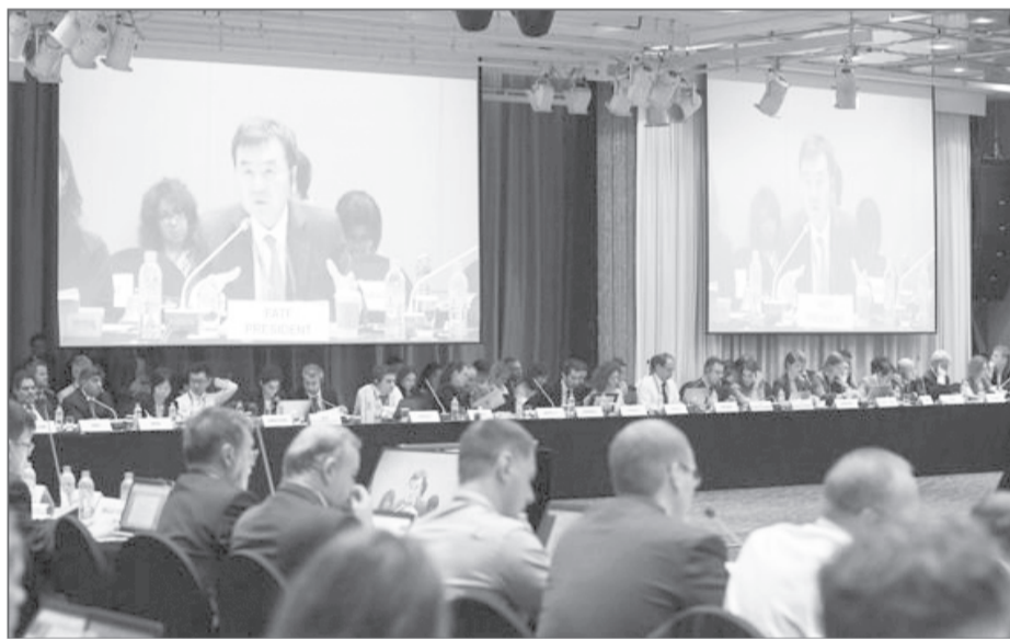
FATF به نفع ایران رأی داد

برای ایران بزرگ و هزینه بر بود که در سال ۱۳۹۳ قانون مبارزه با تأمین مالی تروریسم در مجلس شورای اسلامی به تصویب رسید و در ۱۳ اسفندماه ۹۴ تأیید شورای