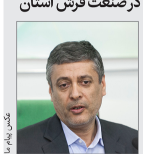
عکس پیام ما