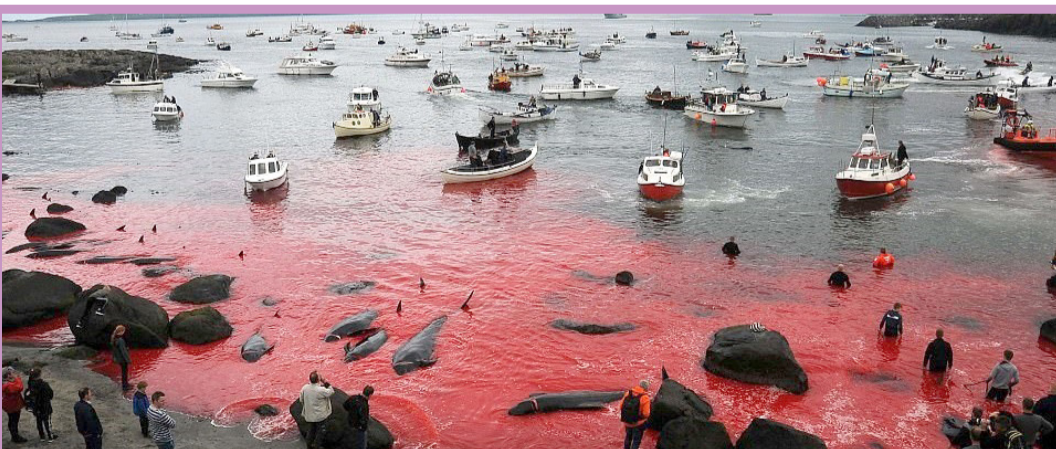
● بر اساس یک سنت قدیمی در جزایر فارو، گروهی از ماهیگیران در این فصل سال که زمان عبور نهنگ‌های مهاجر از نزدیکی ساحل است، تعدادی از نهنگ‌ها را سلاخی می‌کنند./ ادیلی میل