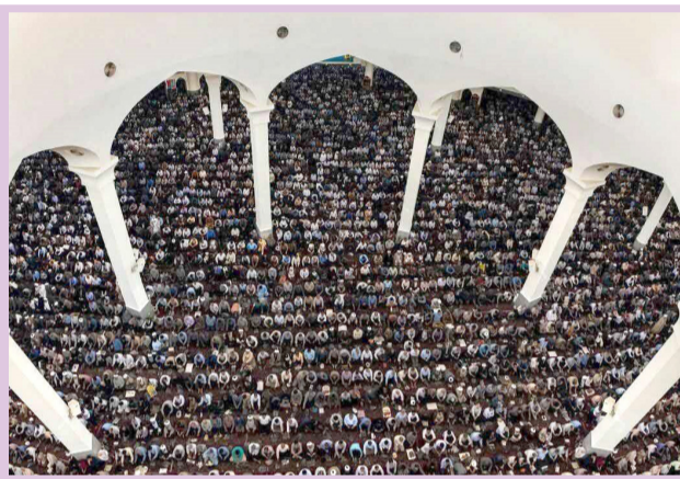
● تصویر جالبی از مصلاهی قم در هنگام برگزاری نماز جمعه روز قدس را مشاهده می کنید./ آدینه قم