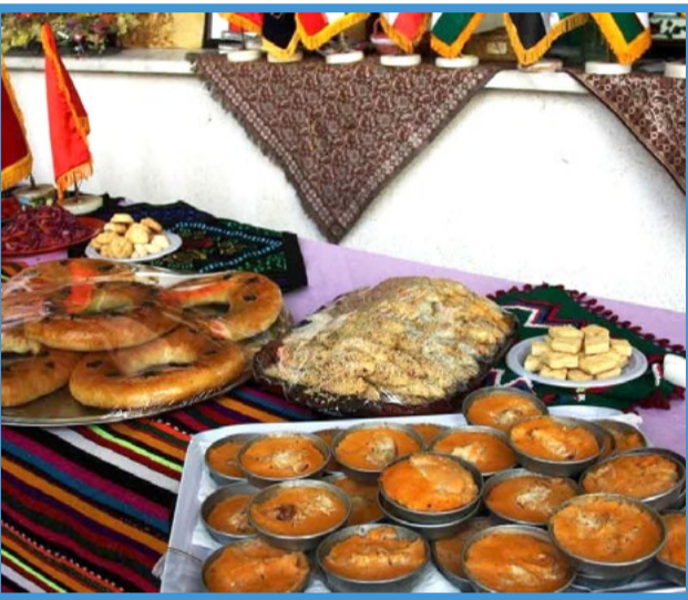
غذاهایی متفاوت در سفره افطار خارجی های ساکن ایران