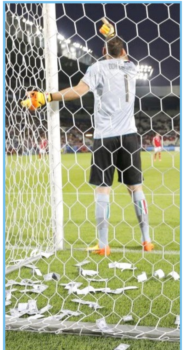
ریختن دلارهای تقلبی بر سر دروازه بان تیم ایتالیا به جرم تصمیم به ترک میلان