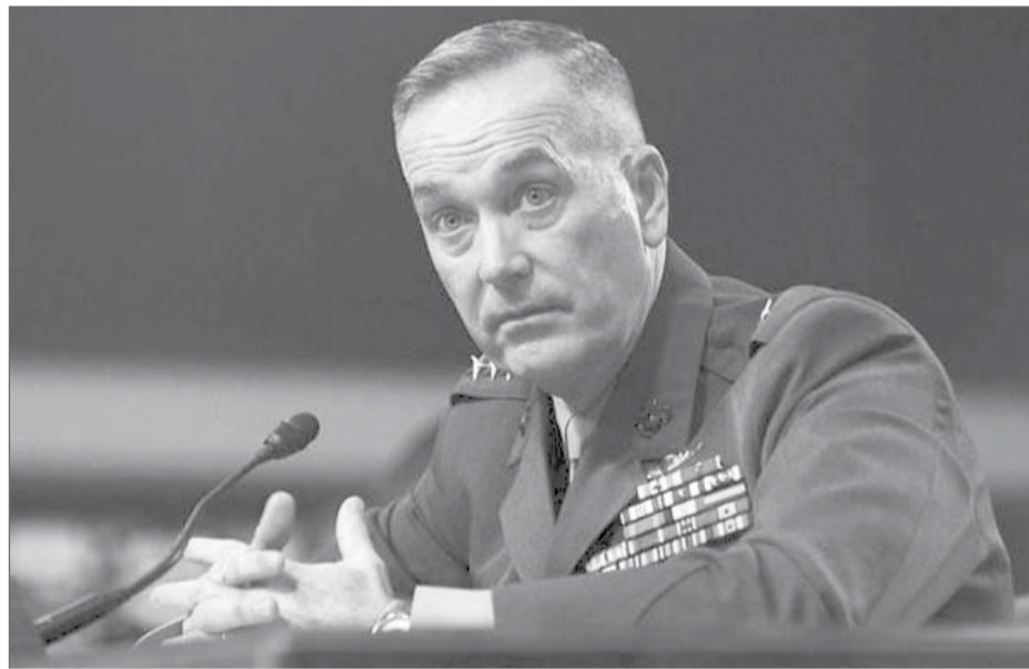
جوزف دانفورد رییس ستاد مشترک ارتش آمریکا

به بحث و گفت و گو درباره آخرین تحولات شبه جزیره کره بپردازند. دانفورد تصریح کرد: یکی از عناصر کلیدی در متوقف کردن فعالیت های هسته ای در کره در گرو همکاری با چین است. وی اظهار کرد: برای قضاوت در مورد رویدادهای چند هفته گذشته کمی زود است. این مقام ارشد آمریکایی همچنین خاطرنشان کرد، وزارت دفاع این کشور از تلاش های رکس تیلرسون، وزیر امور خارجه این کشور حمایت می کند. دانفورد اظهار کرد: کیم جونگ اون، رهبر کره شمالی همچنان در مسیر حرکت به سمت کلاهک های هسته ای پیش می رود. از سوی دیگر دانفورد گفت: جیمز ماتیس، وزیر دفاع آمریکا طی روزهای آینده با همتای ترک خود دیدار خواهد کرد؛