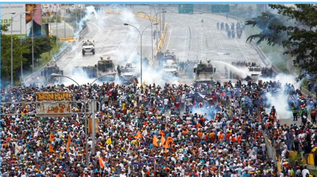
عکس اعتراض های خیابانی مردم ونزوئلا در شهر کاراکاس