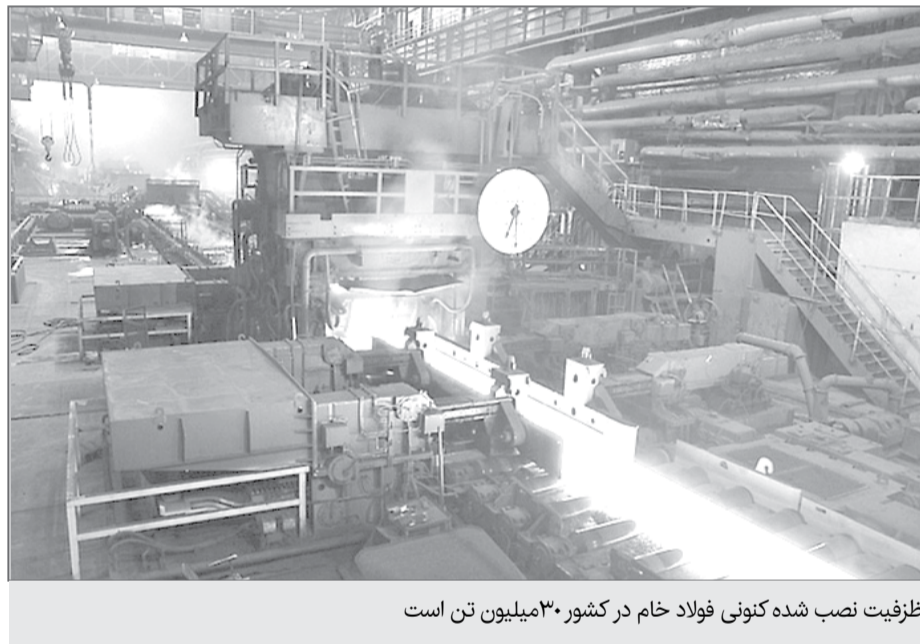
ظرفیت نصب شده کنونی فولاد خام در کشور ۳۰ میلیون تن است

این عضو هیات نمایندگان اتاق تهران با بیان اینکه تولید فولاد در سال گذشته ۱۸ میلیون تن فولاد خام ( ۱۴ تا ۱۵ میلیون تن مصرف داخلی ۳ تا ۴ میلیون تن صادرات) بوده است ولی ظرفیت نصب شده کنونی فولاد خام در کشور ۳۰ میلیون تن است، می گوید: «هدفگذاری مسئولان برای تولید ۵۵ میلیون تن فولاد در کشور؛ رسیدن به ۱۵ میلیون تن صادرات فولاد و مصرف ۴۰ میلیون تنی در کشور است که از این عدد در واقع ۱۵ میلیون تن مصرف واقعی داخلی است و ۲۵ میلیون تن مصرف ظاهری است که برای تولید کالاهای