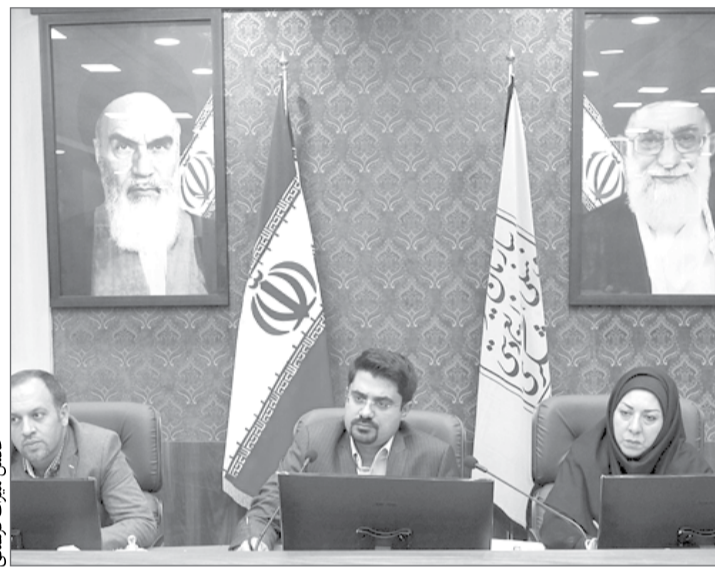
شورای عالی میراث‌فرهنگی، صنایع‌دستی و گردشگری

براساس داده‌های علمی، برنامه‌ریزی صورت گیرد.» وی با توجه به اقدام‌های مقطعی که در گذشته برای ایجاد حساب اقماری انجام گرفته بود، اظهار کرد: «مرکز آمار ایران در سال‌های پیشین، در چند نوبت گام‌هایی برای ایجاد شبکه آمار گردشگری برداشت، اما هر بار متوقف شد و به‌دلایلی تاکنون اقدام عملی در این باره انجام نشده است. تا اینکه خردادماه امسال طرح آن با حمایت معاون اول رئیس‌جمهوری، در شورای عالی میراث‌فرهنگی، صنایع‌دستی و گردشگری مصوب شد تا در هماهنگی با سایر دستگاه‌ها، موانع و مشکلات آن مرتفع