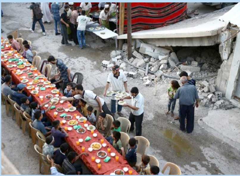
روزه داری مسلمانان کشورهای سوریه و عراق با وجود جنگ و بی خانمانی / رویترز