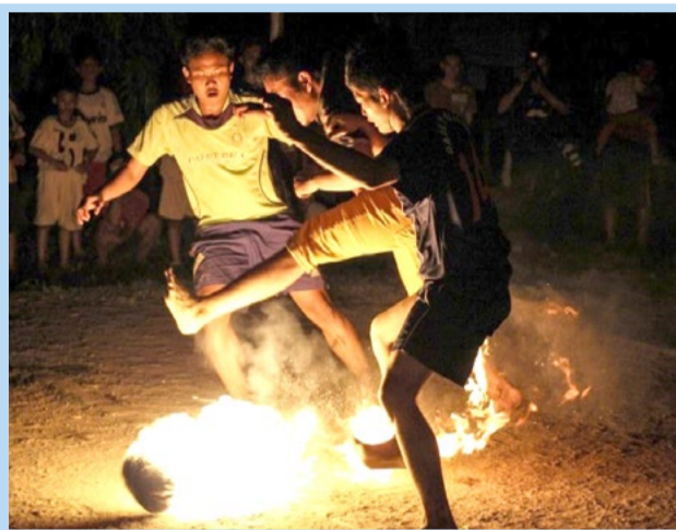
بازی سنتی فوتبال با توپ شعله ور در اندونزی یک ورزش محلی است