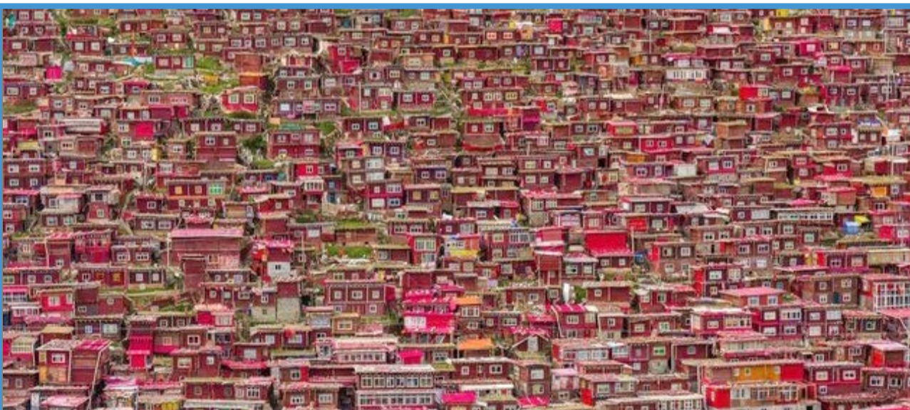
خانه های رنگارنگ چینی ها / نشنال جئوگرافیک