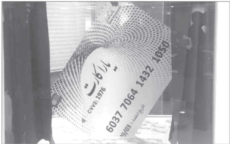
«یارا کارت» روز گذشته در بانک کشاورزی رونمایی شد

مسیر دریافت این تسهیلات قرار گیرد. آنطور که ایسنا نوشته، روال به این ترتیب است که کارت یارانه به عنوان وثیقه در اختیار بانک قرار گرفته و با توجه به منابعی که در هر ماه در آن واریز می‌شود تا سقف پنج میلیون تومان تسهیلات اختصاص خواهد یافت. بدین ترتیب حداکثر تسهیلات پنج میلیون تومان است اما این الزامی برای بانک ایجاد نمی کند چرا که میزان پرداخت تسهیلات متفاوت خواهد بود به طوری که براساس جداول تعریف شده برای خانوارهای یک نفره مبلغ ۱۲ میلیون ریال تعریف شده است. مثلا اگر مشتری بر اساس یارانه خانوار خود می‌تواند کارت سه میلیون تومانی دریافت کند، ولی خواهان دریافت تسهیلات پنج میلیون تومانی