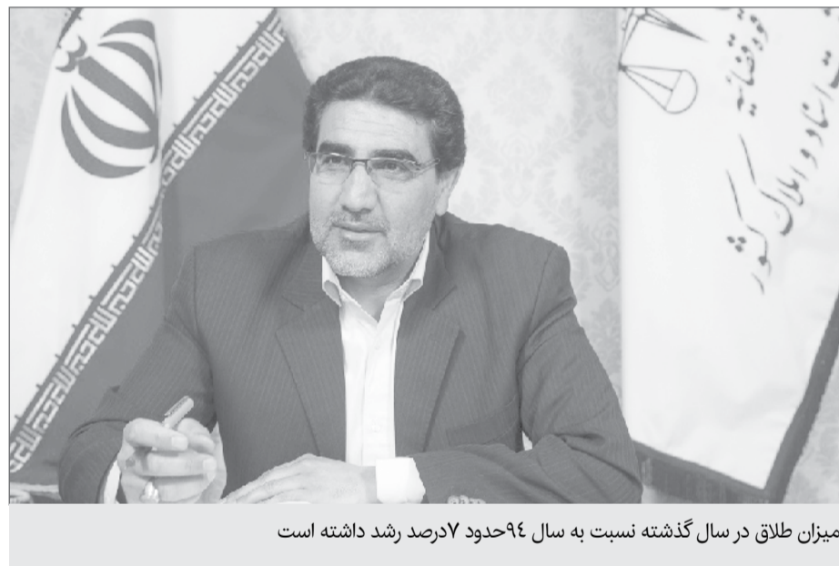
میزان طلاق در سال گذشته نسبت به سال ۹۴ حدود ۷ درصد رشد داشته است