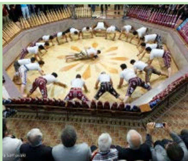
مراسم تقدیر از پیشکسوتان ورزش های زورخانه ای