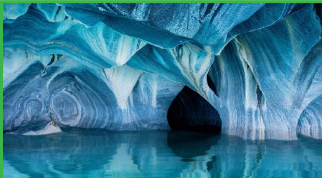
عکس روز دوشنبه نشنال جئوگرافیک / تصویر زیبا از غارهای مرمرین در دریاچه کارا