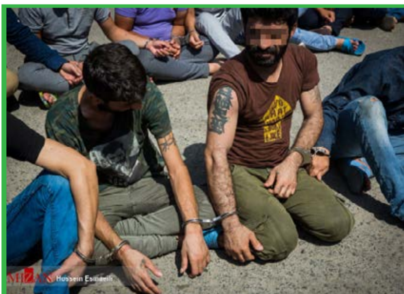
در عملیات پلیس آگاهی ۱۴۵ سارق، زورگیر و کیف قاپ در قالب ۳۰ باند شناسایی و دستگیر شدند. / میزان