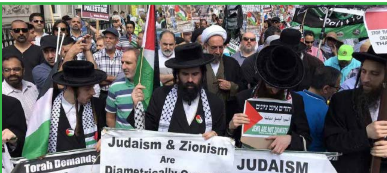
روز قدس لندن ها در آخرین یکشنبه ماه رمضان