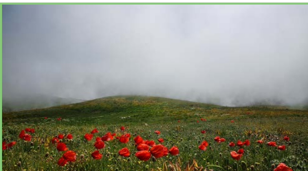
«ماسال» شهری در استان گیلان که در کنار کوه های تالش واقع شده است / میزان