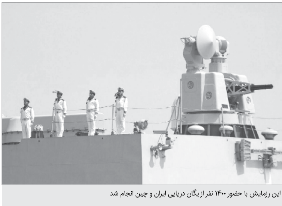
این رزمایش با حضور ۱۴۰۰ نفر از یگان دریایی ایران و چین انجام شد

امیردریادار آزاد گفت: در این سلسله تمرین ها تبادل اطلاعات بین اتاق های عملیات و تمرین مشترک افسر نگرهان و صورت بندی های مختلف در دریا انجام شد و هدایت تمامی تمرین ها از محل کنترل و فرماندهی منطقه یکم امامت نیروی دریایی راهبردی ارتش جمهوری اسلامی تمرین مشترک نظامی نیروی دریایی ایران و چین روز یکشنبه از شرق تنگه هرمز تا دریای عمان انجام شد. ناوگروه چین متشکل از دو ناوشکن، یک ناو پشتیبانی به همراه یک فروند بالگرد، صبح روز پنجشنبه ۲۵ خرداد در منطقه یکم نیروی دریایی ارتش در بندرعباس پهلو گرفت و آئین استقبال رسمی از ناوگروه نیروی دریایی ارتش چین با حضور دریادار بابک عبداللهی جانشین فرمانده منطقه یکم نیروی دریایی ارتش انجام