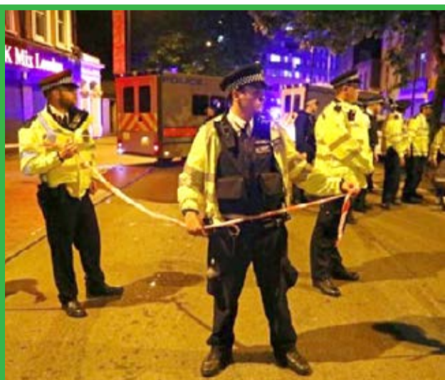
جو امنیتی پس از حمله با خودرو به نمازگزاران مسجدی در لندن