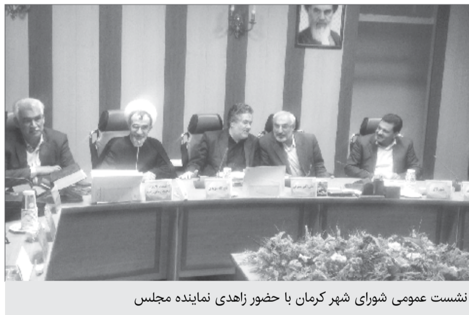
نشست عمومی شورای شهر کرمان با حضور زاهدی نماینده مجلس

باید همان کار گروه تخصصی ایجاد شود تا این مسئله را بررسی کند و تصمیمی گرفته شود تا به نفع مردم و شهر باشد نه نفع و ارگان خاصی! زاهدی همچنین با اشاره به پروژه های در حال اجرای شهر کرمان گفت این پروژه تاثیر بسیاری در آینده شهر دارد علی رغم اینکه شهرداری کرمان از لحظه مالی در مضیغه بود اما این پروژه ها را شروع کرد. نماینده مردم کرمان و راور درحالی که جلسه شورای شهر آمده تا به اعتراض کاندیدهای بازنده انتخابات شورای پنج رسیدگی کند و صحبت آن ها را به مسئولان انتقال دهد. این اتفاق درحالی رخ داد که روزهای گذشته علی رغم اعتراض های شدید بعضی از کاندیدهای انتخابات شورای شهر صحت انتخابات شورای شهر کرمان توسط رییس هیات نظارت استان کرمان تایید شد.