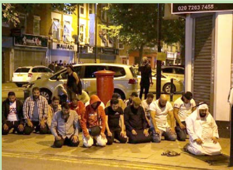
نماز جماعت مسلمانان در نزدیکی محل حمله به مسجد لندن