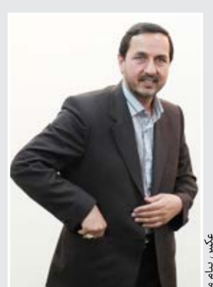
مدیر کل ارشاد کرمان:

افزایش پنج درصدی هزینه‌های درمان ۹۶ بیمه سلامت مکلف به ارائه خدمات بیمه‌ای رایگان برای مستمندان شد