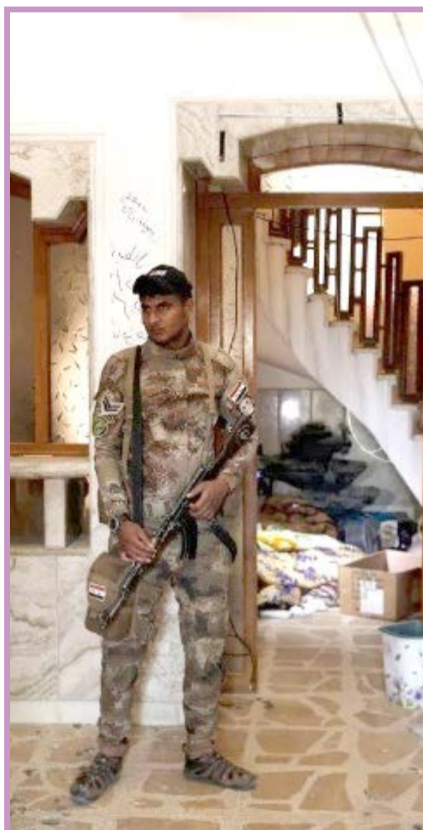
خانه ای که در موصل عراق به عنوان زندان داعش استفاده می شد