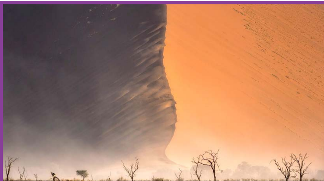
عکس روز شنبه نشنال جئوگرافیک / صحرای نامیب در جنوب آفریقا