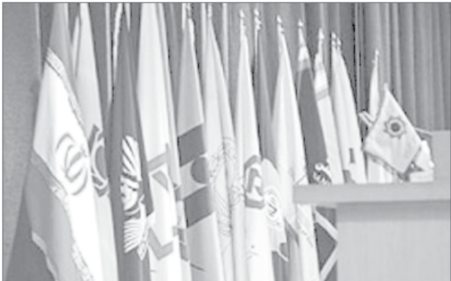
اولویت های تامین مالی سال ۹۶ به بانک ها ابلاغ شد