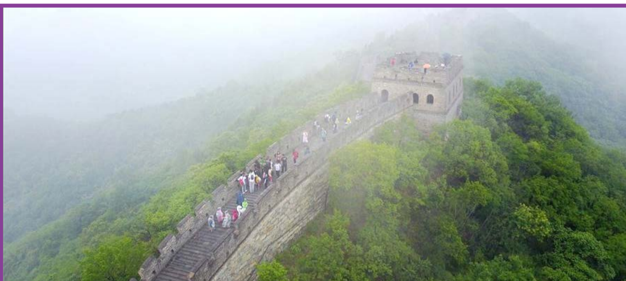
دیوار بزرگ چین در میان مه و باران