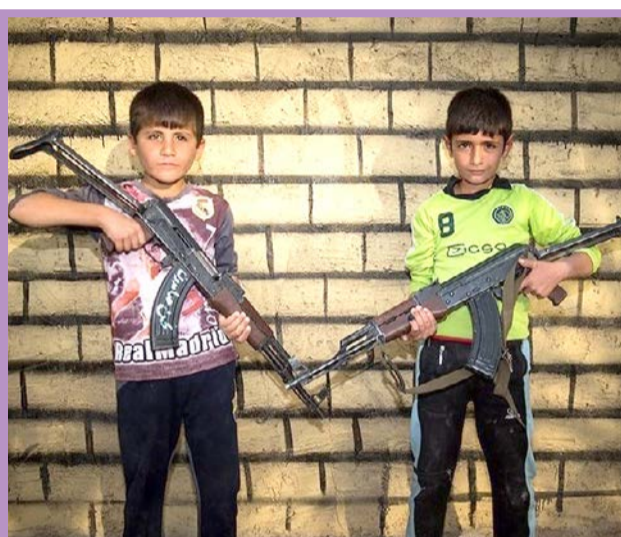
آموزش کار با سلاح به کودکان عراقی برای آمادگی مقابله با داعش