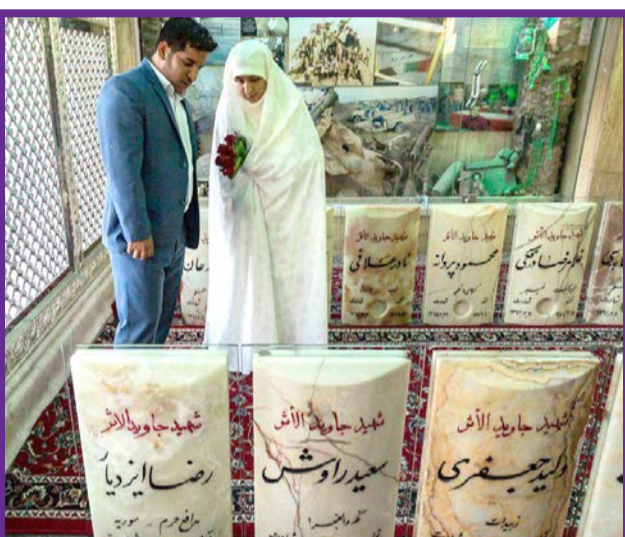
برگزاری جشن ازدواج در کنار شهدای گمنام در کرج / مهر