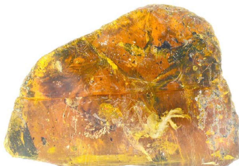
کشف بقایای جوجه ۹۹ میلیون ساله داخل سنگ کهریای قدیمی در میانمار