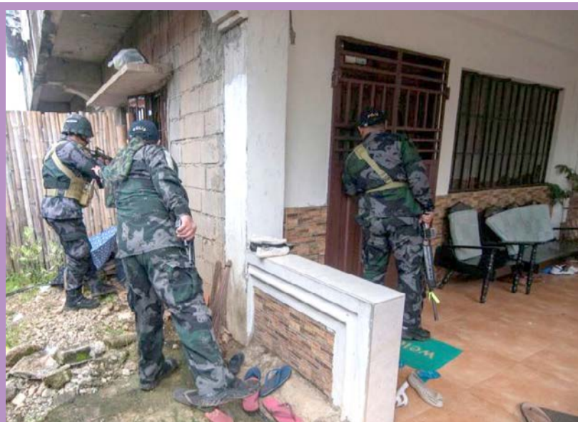
نبرد نیروهای ارتش فیلیپین با شبه نظامیان وابسته به داعش