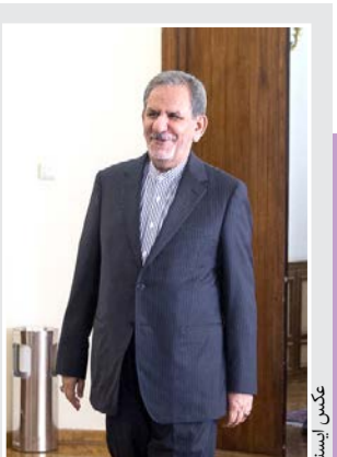
معاون اول رئیس جمهور: