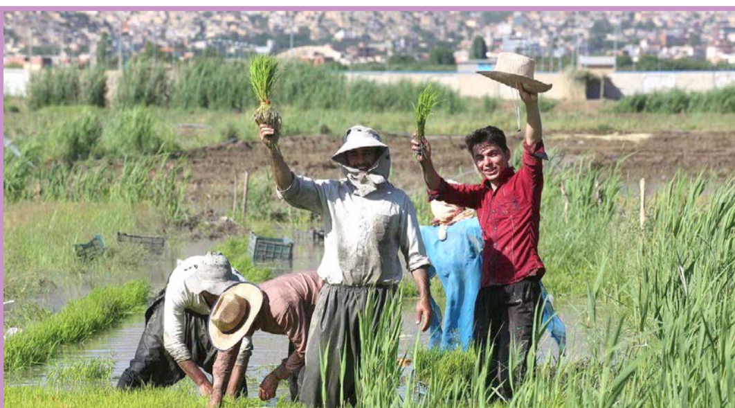
شالیکاران در زمین های سبز