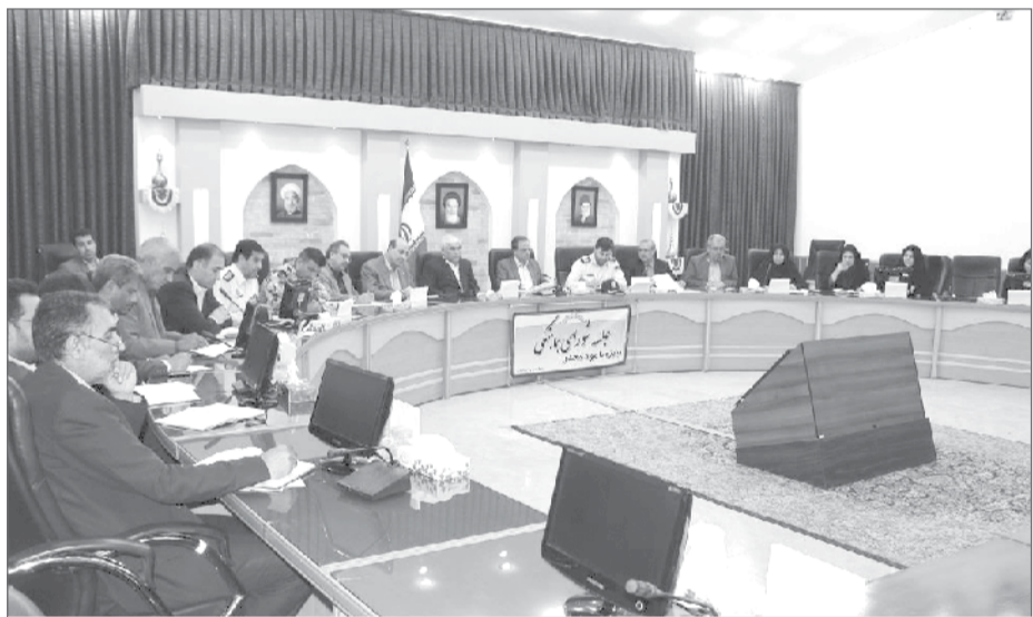
نشست شورای هماهنگی مبارزه با مواد مخدر کرمان