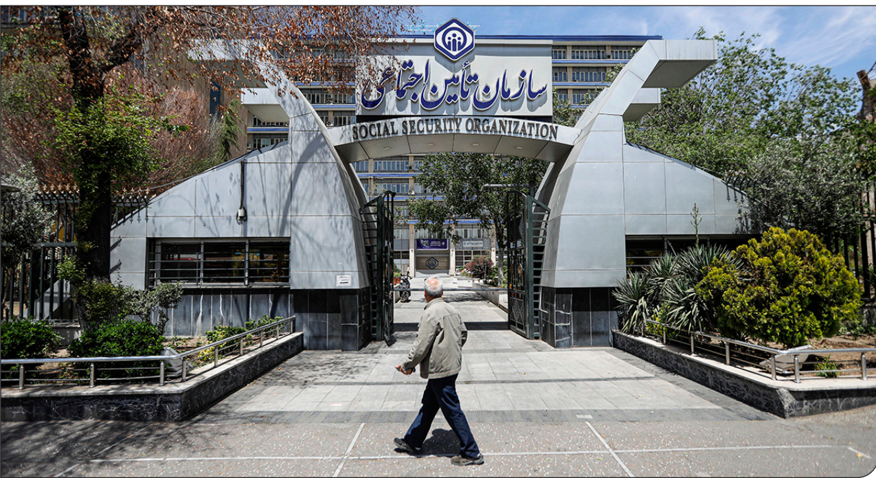
انجمن گمداری ۱

ا پیام ما آ آینده بیش از نیمی از جمعیت ایران به سرنوشت سازمانی گره خورده است که سال‌هاست با ناترازی منابع، بدهی‌های انباشته، تغییرات بازار کار و افزایش هزینه‌های درمان دست‌وپنجه نرم می‌کند. این چالش‌ها می‌تواند از یک مسئله بیمه‌ای فراتر رود و به بحرانی برای امنیت معیشتی و رفاه اجتماعی میلیون‌ها ایرانی تبدیل شود.