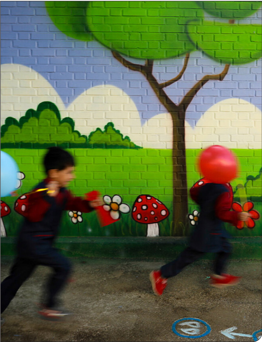
| اینجا |

به گفته اولیای برخی مدارس حاشیه‌ای شهر همدان، سن ترک تحصیل ورود به بازار کار در میان دانش‌آموزان پسر کاهش یافته است