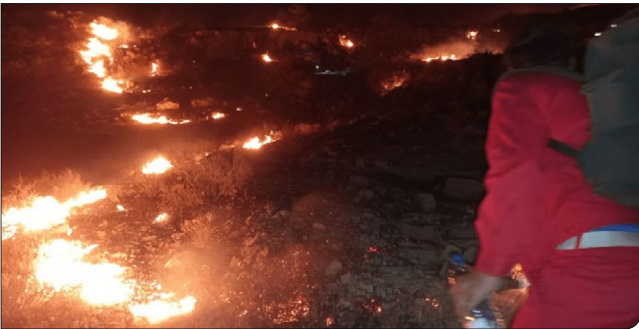
قاسم | آغا

با این حال، نمی‌دانم آیا امکان انجام عمل را خواهیم داشت و حمایتی از من می‌شود یا نه