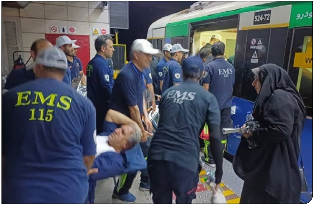
همشهری آرادین - آرنج

پرونده قدیمی اورژانس ریلی در قالبی جدید به میز مدیریت بحران تهران بازگشت