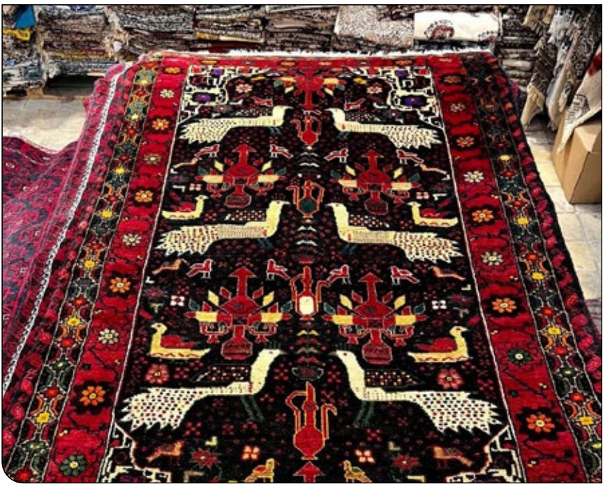
پیام ما |

با این همه، در حجره‌های بازار یزد هنوز گردشگرانی هستند که می‌ایستند، نگاه می‌کنند، دست بر تار و پود فرش می‌کشند و میان رنگ‌های لاک‌ی و سرمه‌ای، چیزی فراتر از یک کالا می‌بینند. شاید همین مواجهه آرام، هنوز یکی از صادقانه‌ترین شکل‌های معرفی ایران باشد؛ ایرانی نه در قالب شعار، که در اندازه یک فرش دست‌باف، پهن‌شده در خانه‌ای دور از این خاک.