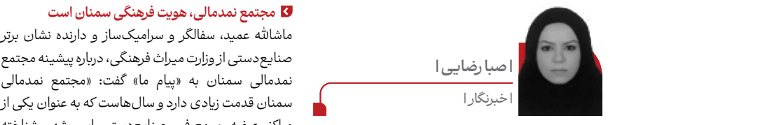
اصبا رضایی | اخیریکارا

مجتمع نمدمالی سمنان قرار است فروخته و سپس تخریب شود؛ تصمیمی که با اعتراض بخشی از فعالان صنایع دستی و میراث فرهنگی استان روبه‌رو شده است. مدیرکل میراث فرهنگی، گردشگری و صنایع دستی سمنان می‌گوید منابع حاصل از فروش این مجتمع برای تکمیل بازارچه صنایع دستی استان اختصاص می‌یابد. با این حال، معترضان معتقدند این مجموعه بخشی از هویت فرهنگی سمنان است و می‌توان آن را به‌جای واگذاری، به بازارچه دائمی صنایع دستی یا مرکز فرهنگی گردشگری تبدیل کرد. شکایت‌ها و پیگیری‌های حقوقی بهره‌برداران نیز به گفته مدیرکل میراث فرهنگی استان، تاکنون در مراجع قضایی به نتیجه نرسیده و فروش مجتمع همچنان در دستور کار است.