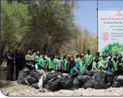
تأثیر بسزایی خواهد داشت.

با مشارکت داوطلبانه مجموعه ۵۰۰ نفر از افق کوروش‌ها بالغ بر ۱۵۰ تن زباله از دل طبیعت کشورمان جمع‌آوری شد