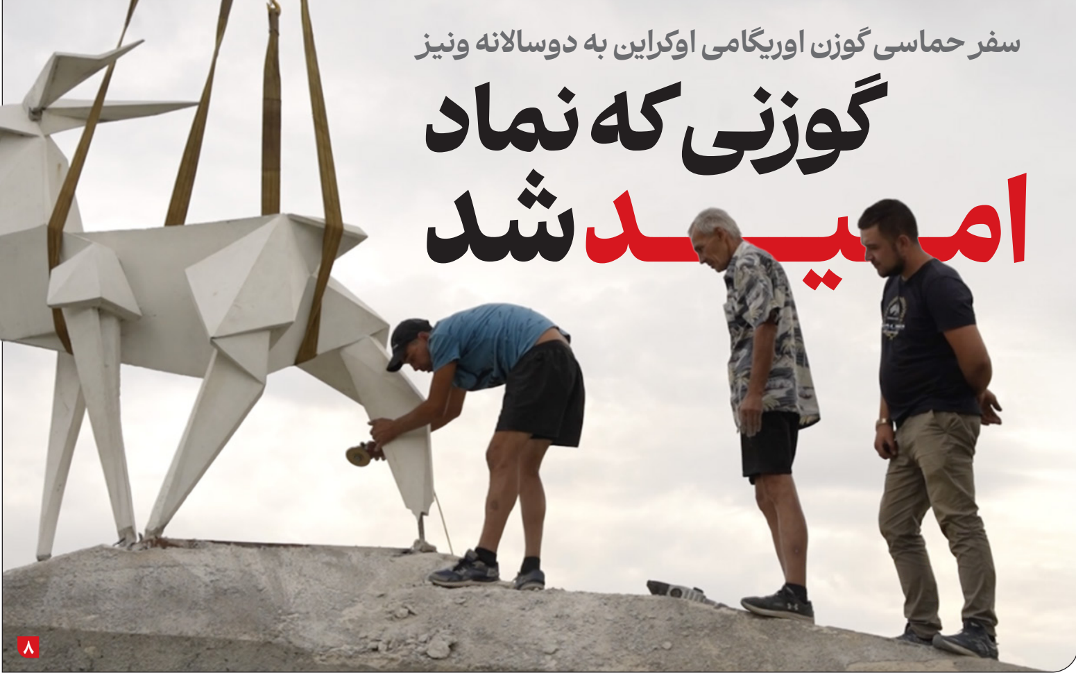
سفر حماسی گوزن اوریگامی اوکراین به دوسالانه ونیز

«جنگ» صرفاً یک رخداد ژئوپلیتیک، یک ستیز میان دولت‌ها یا یک منازعه نظامی نیست؛ جنگ در نخستین و عمیق‌ترین لایه‌اش، مداخله‌ای خشونت‌بار در ریتم زندگی روزمره است. فروپاشی در نظمی از تکرارها و عادت‌ها و پیش‌بینی‌ها که به افراد امکان می‌دهد خودشان را در جهان جای دهند، آینده کوتاه‌مدتشان را تصور کنند و در میان این همه بی‌ثباتی جهانی، دست‌کم به چند نقطه ثابت تکیه کنند. اکنون ما فقط با شکستن ریتم زندگی مواجه نیستیم، بلکه با نوعی فروپاشی همه‌جانبه عرصه‌های مادی و معنوی زندگی روبه‌رویم. قطع اینترنت، ابهام مداوم دربارهٔ میزان و شدت ادامه یادداشت را در صفحه ۲ بخوانید.