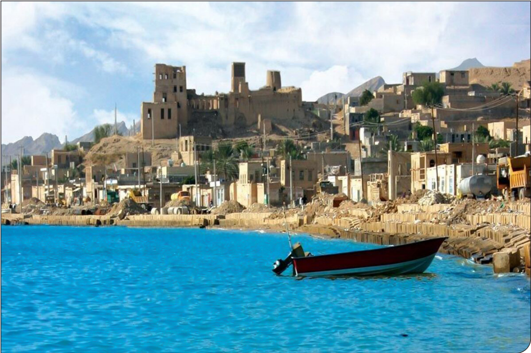
ایستگاه مسافری در بندر کهن

او با اشاره به تداوم بی‌وقفهٔ خدمات پلیس راهور تا آخرین روز سال، فعال بودن مراکز تعویض پلاک حتی در روزهای غیرتعطیل، هماهنگی برای تأمین پایدار سوخت تهران و البرز با کمک استان‌های معین و تمدید اعتبار وکالت‌نامه‌های نقل‌وانتقال خودرو تا پایان خرداد ۱۴۰۵، طراحی پلاک ویژهٔ گردشگری را نیز بخشی از اقدامات توسعه‌ای در حوزهٔ شمارگذاری برشمرد که رونمایی آن به پس از عبور از شرایط جنگی موکول شده است. ا ایستا