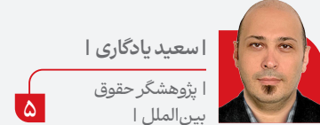
اسعد یادگاری پژوهشگر حقوق بین‌الملل