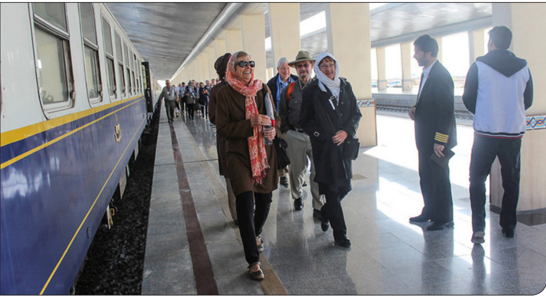
ایستگاه | ۸

مدیریت روایت می‌تواند برند گردشگری ایران را نجات دهد؟