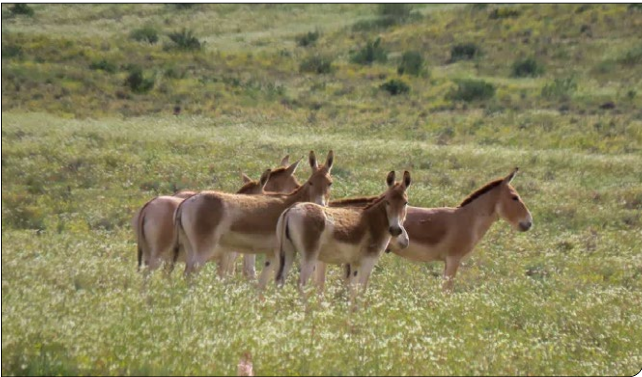
نگار: حجت تیموری (۹۰)

برد زیستگاه برسد و در صورت وقوع بحران‌هایی مانند خشکسالی، جمعیت با کاهش شدید روبه‌رو شود