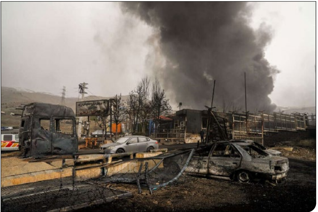
امداد خروشی - ایستاد ۱۹۹