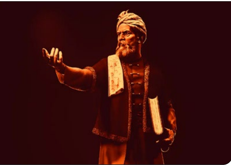
مجسمه‌ی شاعر بزرگ ایرانی، مولانا جلال‌الدین محمد بلخی، در شهر بلخ، افغانستان

او نیز به راستی و به درستی در کنار بزرگانی چون «عطار»، «مولانا جلال‌الدین محمد بلخی»، «شاه نعمت‌الله ولی کرمانی»، «سعدی» و «حافظ شیرازی» و «صائب تبریزی» و دیگر بزرگان، خوش درخشیده‌اند که هر کدام پایگاه عظیم دانش و آگاهی و عرفان و خرد و ادبیات گشته‌اند.