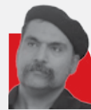
اشهراد شاهرخی طهرانی | نویسنده و شاعرا

به بهانه روز بزرگداشت «فردوسی» شعر در سلوک و ادبیات فردوسی