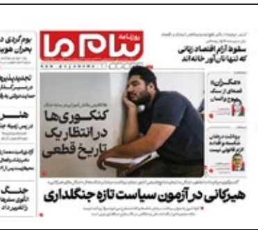
پیام ما دیروز