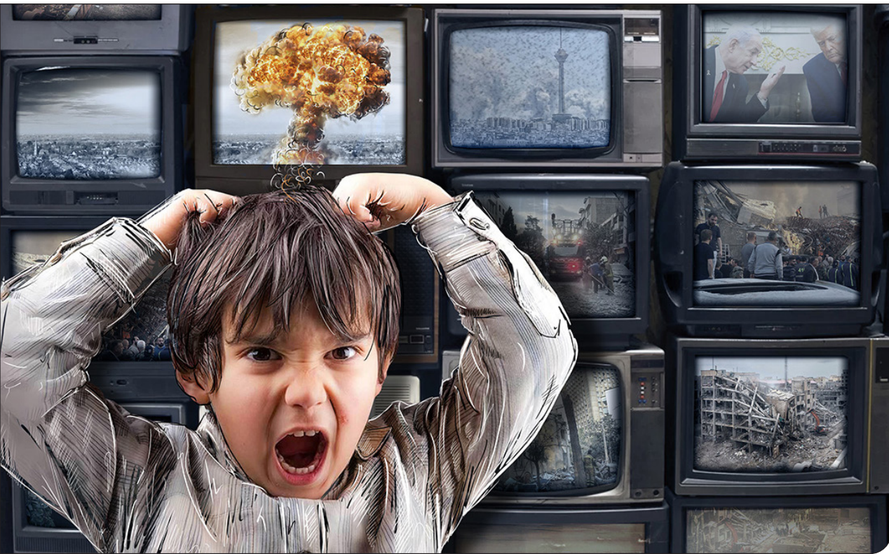
طرح مجسمی ملازاده - پدیده ما

یکی از روان‌شناس انجمن: کودک نباید مدام نگران باشد که موشک جان عزیزانش را بگیرد