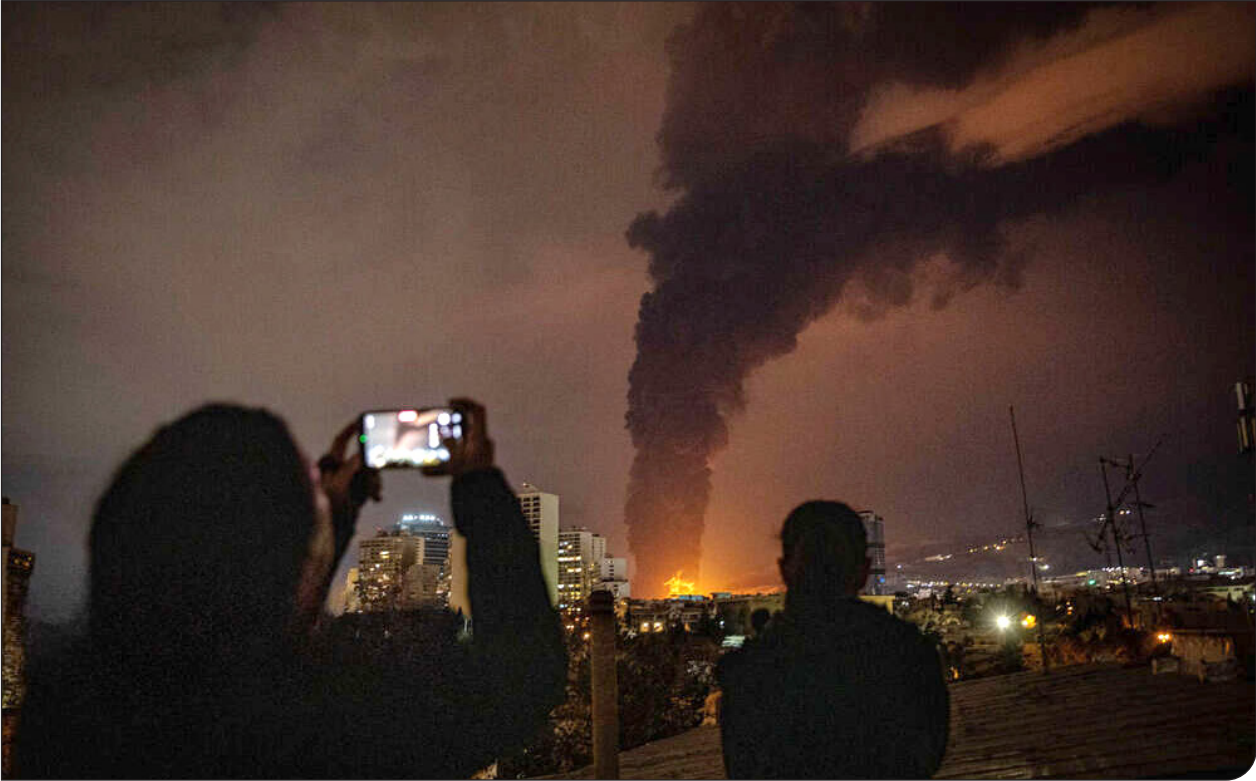
اسیلا | ۹۵

بهای اقلیمی جنگ علیه ایران برای اتمسفر زمین چقدر تمام شد؟ سنجش میزان انتشارکربن در چنین درگیری گسترده‌ای، فراتر از شمارش ساده تعداد موشک‌های شلیک‌شده یا تانکرهای منهدم‌شده است. اکنون این پیرش مطرح است که چگونه باید «کربن حاصل از نبرد» و «اختلال در چرخه‌های کلان انرژی» را مقایسه کرد؟ از یک سو، شعله‌های سرکش آتش در پالایشگاه‌ها و مصرف سرسام‌آور سوخت جت در جنگنده‌ها، حجم عظیمی از دی‌اکسیدکربن را روانه جو می‌کنند؛ اما از سوی دیگر، توقف اجباری غول‌های اقیانوس پیمان‌دز تنگه هرمز و جابه‌جایی‌های جمعیتی، پارامترهایی هستند که محاسبات آلایندگی را با چالش روبرو می‌کنند. اما آیا سکون اجباری بخشی از صنعت، واقعاً به معنای کاهش انتشار است یا تنها جرقه‌ای برای بارگشت به سوخت‌های کثیف‌تری چون زغال‌سنگ در گوشه‌ای دیگر از جهان؟ در میانه این میدان دودآلود، شناخت متغیرهایی که گاه به‌صورت متناقض باعث کاهش یا جهش ناگهانی آلایندگی می‌شود، تنها راه برای فهم عمق فاجعه‌ای است که شاید سال‌ها پس از خاموشی جنگ، اثرات خود را در گرمایش جهانی نشان دهد.