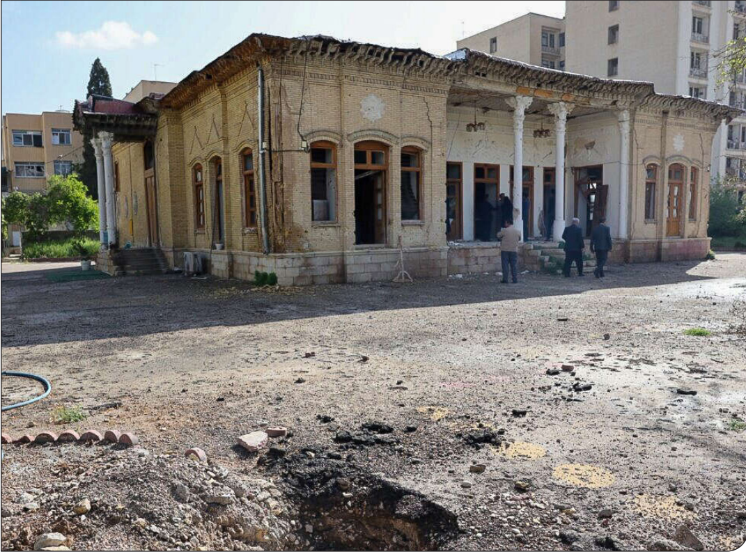
تخریب‌های گسترده در بناهای تاریخی تهران