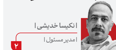
انکیسا خدیژی | مدیرمسئول |