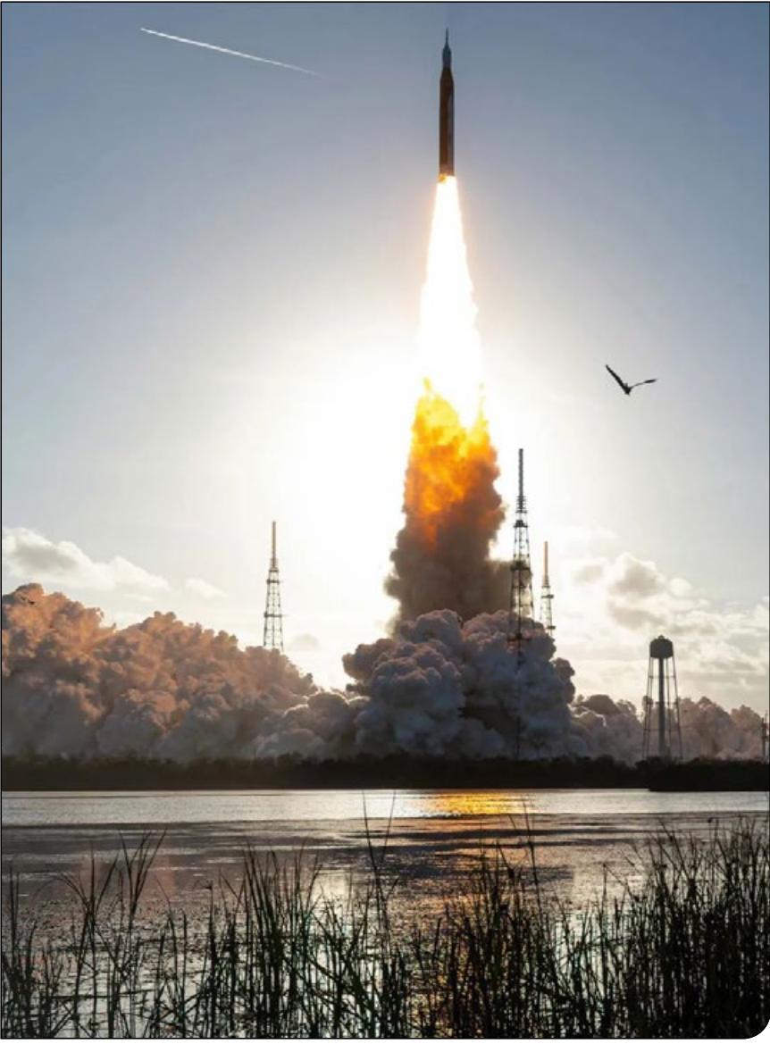
I AP (تغ)

امروز ۱۲ آوریل ۲۰۲۶، روز ویژه‌ای برای علاقه‌مندان به فضا است؛ «روز جهانی پرواز فضایی انسان». بازگشت اخیر چهار فضانورد از مأموریت تاریخی آرتیمیس ۲ ناسا به زمین، این روز را خاص‌تر کرده است. ۶۵ سال پیش، در چنین روزی، یوری گاگارین با فریاد معروف «رفتم!» اولین گام را در فضا برداشت. امروز، درحالی‌که انسان دوباره به فاصله‌ای دورتر از همیشه از زمین رسیده، برگزاری «روز جهانی پرواز فضایی انسان» یادآوری می‌کند که کاوش فضایی تنها ماجراجویی کیهشانی، بلکه ابزاری قدرتمند برای حل چالش‌های پایداری بر روی زمین است.