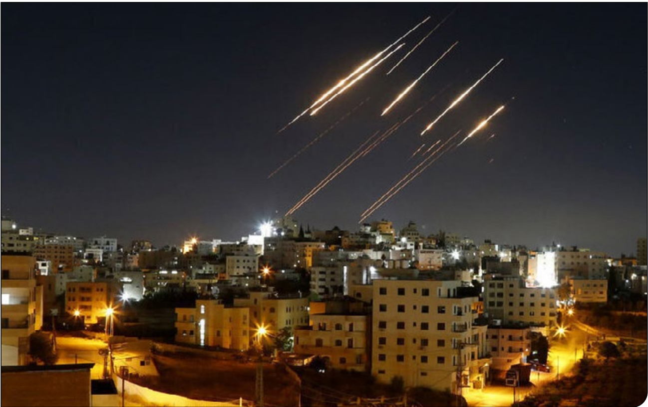
همشهری آنلاین | روز

آتش جنگ، دامن گردشگری را گرفته و پیش‌بینی‌های بازار سفر را بی‌اعتبار کرده است