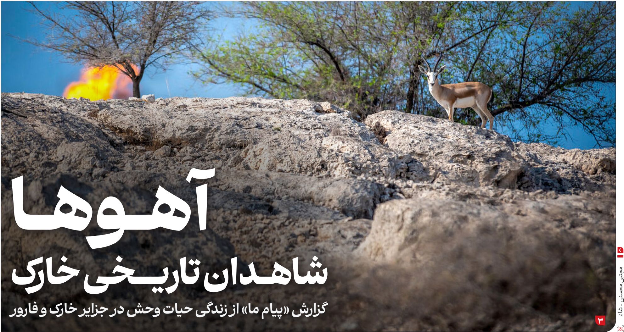
گزارش «پیام ما» از زندگی وحش در جزایر خارک و فارور

شهروندان نگران انتشار آلودگی مواد شیمیایی و سمی به مناطق مسکونی اطراف هستند