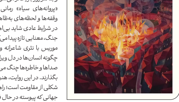
پریسیلا موریس / ترجمه: مرگم بلوری

«پروانه‌های سیاه» رمانی است درباره سکوت‌ها، وقفه‌ها و لحظه‌های به‌ظاهر کوچک؛ لحظه‌هایی که در شرایط عادی شاید بی‌اهمیت باشند، اما در بستر جنگ، معنایی تازه پیدا می‌کنند. موریس با نثری شاعرانه و تصویری نشان می‌دهد چگونه انسان‌ها در دل ویرانی، هنوز به اشیا، رنگ‌ها، صداها و خاطرها جنگ می‌زنند تا چیزی از خود باقی بگذارند. در این روایت، هنر نه جمالی و لوکس، بلکه شکلی از مقاومت است؛ راهی برای حفظ انسانیت در جهانی که پیوسته در حال فروپاشی است.