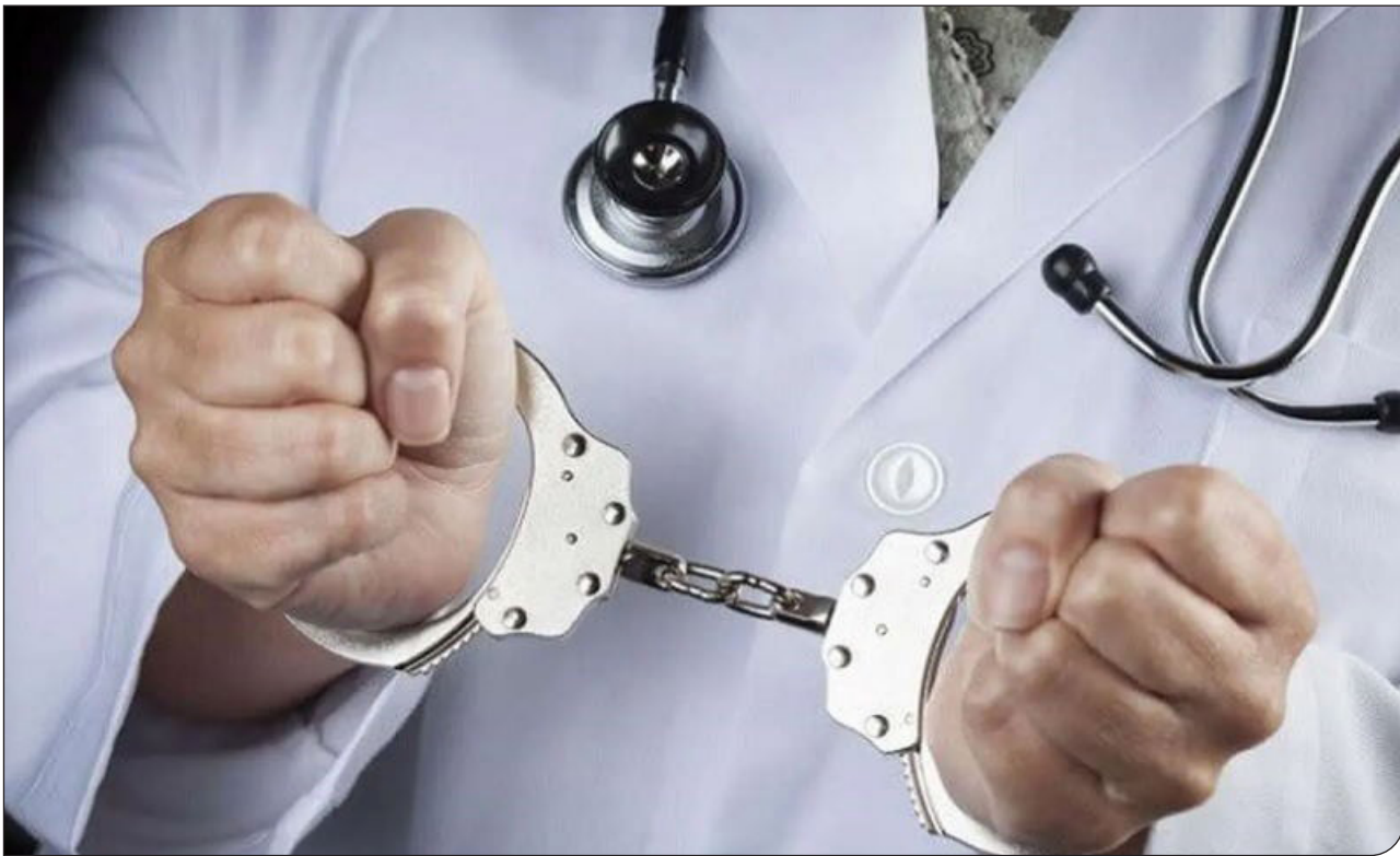
انصاف نیوز |

رئیس سازمان نظام پزشکی: تعداد افراد جامعه پزشکی که زندانی هستند، به ۱۰ نفر نمی‌رسد