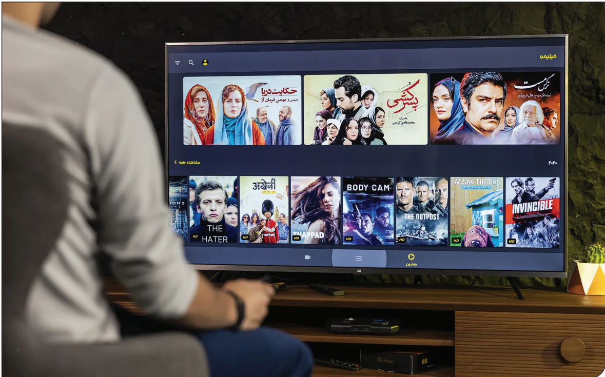
اقتصاد