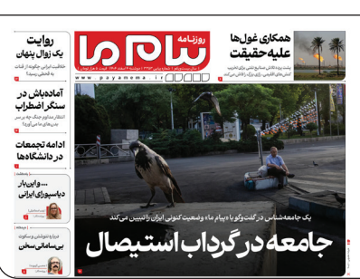
پیام ما در ایران

در فصل پنجم این طرح که مربوط به مجازات‌ها است، یکی از مجازات‌های دینظرگرفته‌شده برای رسانه‌ها، کاهش پهنای باند و سرعت اینترنت است. درحالی‌که کیفیت اینترنت، حق عمومی شهروندان است و حالا براساس این طرح به‌عنوان ابزار تنبیه در نظر گرفته شده است. باقی مجازات‌ها هم به همین ترتیب است که مشخص نیست بر چه اساسی قرار است این تخلفات تشخیص داده شوند و مجازات اعمال شود.