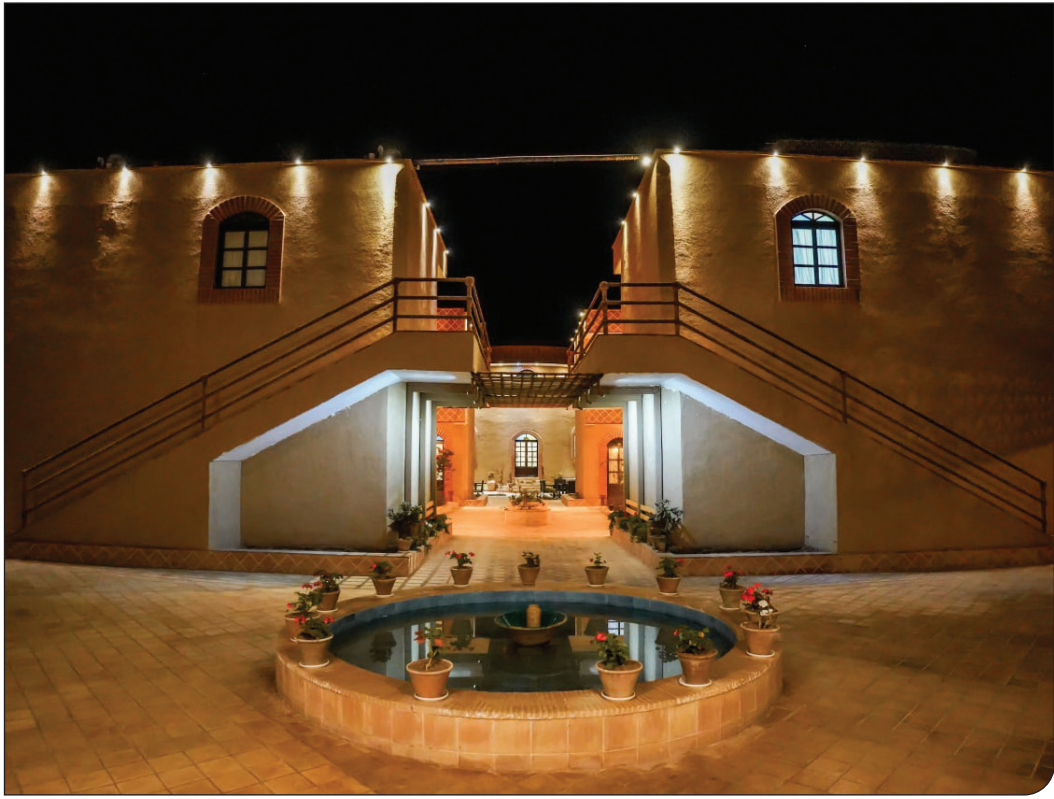
پانزدهم خیرکاران جوان

شریفی تأکید کرد: «ارسال این پرونده، گام نخست در مسیر ثبت جهانی این چشم‌انداز ارزشمند است و پس از بررسی در وزارتخانه و طرح در کمیته ملی میراث جهانی در صورت تأیید در سایه موقت ایران برای ثبت در یونسکو قرار خواهد گرفت. ثبت جهانی دره سیمره می‌تواند نقش مهمی در نگهداری بلندمدت این میراث کم‌ظنیر ارفقای جایگاه علمی منطقه، توسعه گردشگری پایدار و افزایش مشارکت جوامع محلی در صیانت از میراث طبیعی و فرهنگی ایفا کند که این هدف با همکاری نهادهای اجرایی، دانشگاه‌ها و جوامع محلی به‌صورت جدی پیگیری می‌شود.» دره و رودخانه خروشان «سیمره» یکی از مهم‌ترین حوزه‌های تمدنی در غرب ایران به شمار می‌رود که مرز طبیعی میان استان‌های ایلام و لرستان را شکل داده است. ایرونا