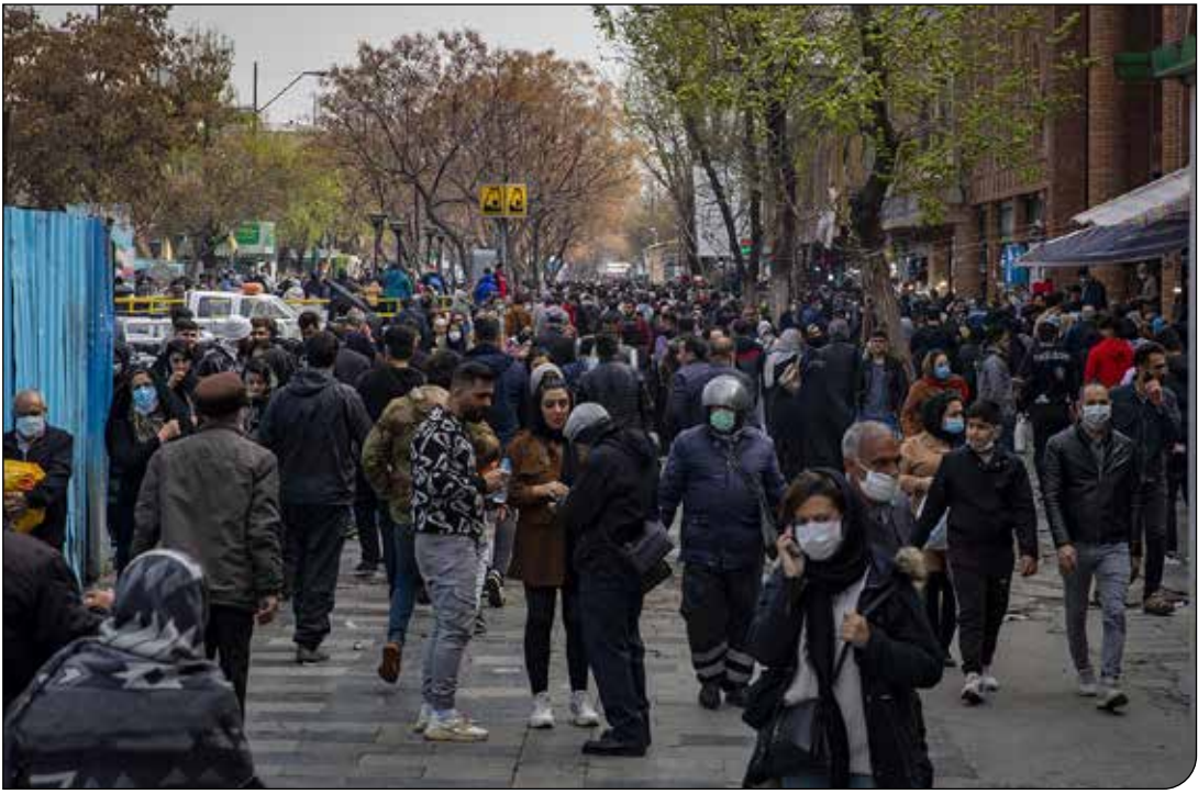
تعداد بزرگ‌ترین تظاهرات در تهران

بررسی سهم جمعیت دارای اشتغال ناقص جمعیت ۱۵ ساله و بیشتر نشان می‌دهد در پاییز ۱۴۰۴، ۹ درصد جمعیت شاغل، به‌دلیل اقتصادی (فصلی، جبرگاری، رکود کاری، پیدا نکردن کار با ساعت بیش‌تر و...) کمتر از ۴۴ ساعت در هفته کار کرده و آماده برای انجام کار اضافی بوده‌اند. این درحالی است که ۳۷.۹ درصد از شاغلین ۱۵ ساله و بیشتر، بیش از ۴۹ ساعت در هفته کار کرده‌اند. الینا