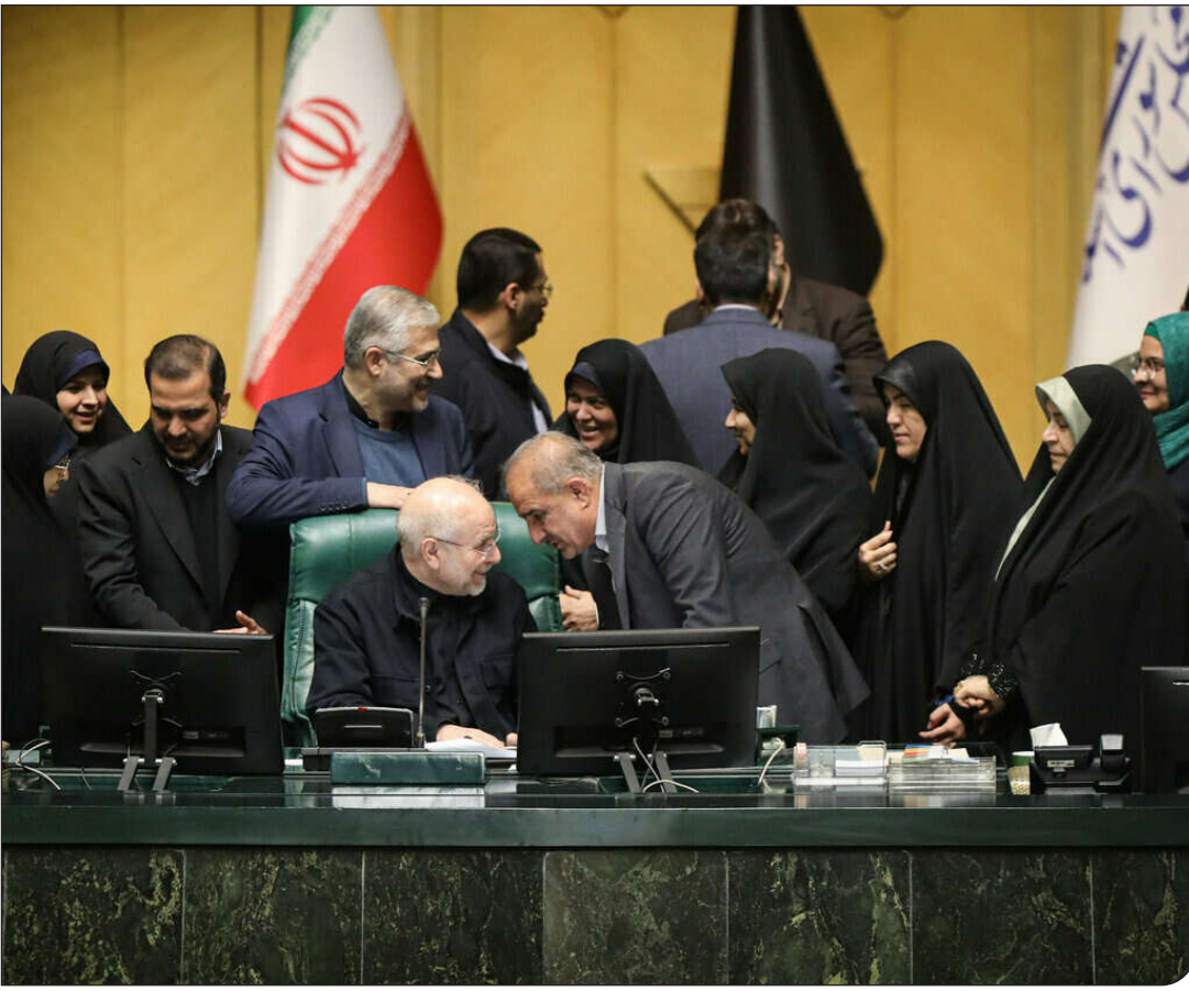
خانه ملت |

اپیام ما روز چهارشنبه بیست و چهارم دی ماه، نمایندگان مجلس با ۲۰۲ رأی موافق، ۱۰ رأی مخالف و ۶ رأی ممتنع از مجموع ۲۳۷ رأی مأخوذه طرح «نحوه برگزاری تجمعات و راهپیمایی‌ها» در دستورکار خود قرار دادند.