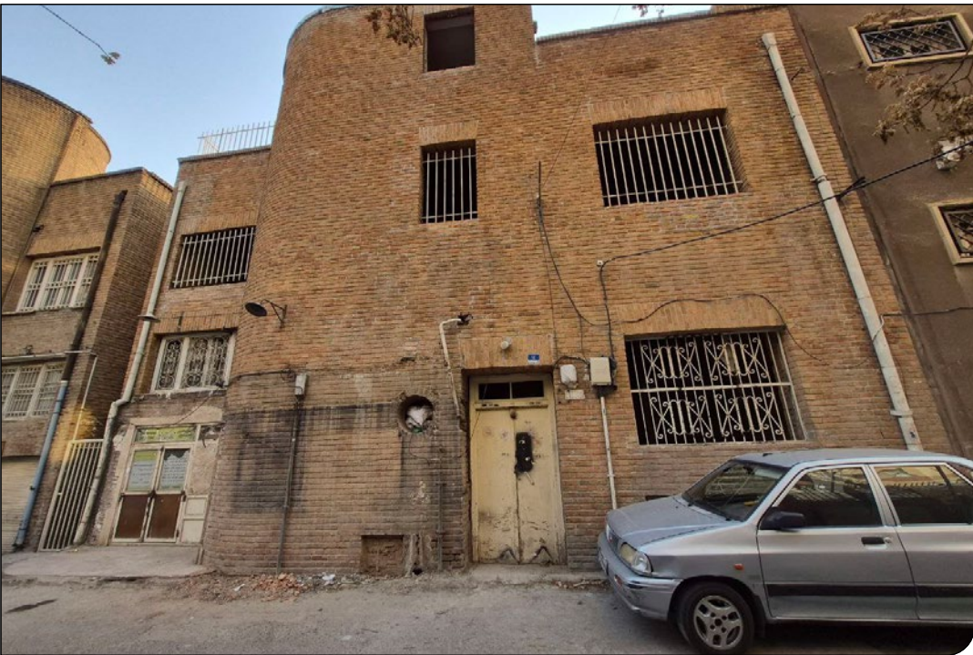
آپتیم ما ۱۹۹۰