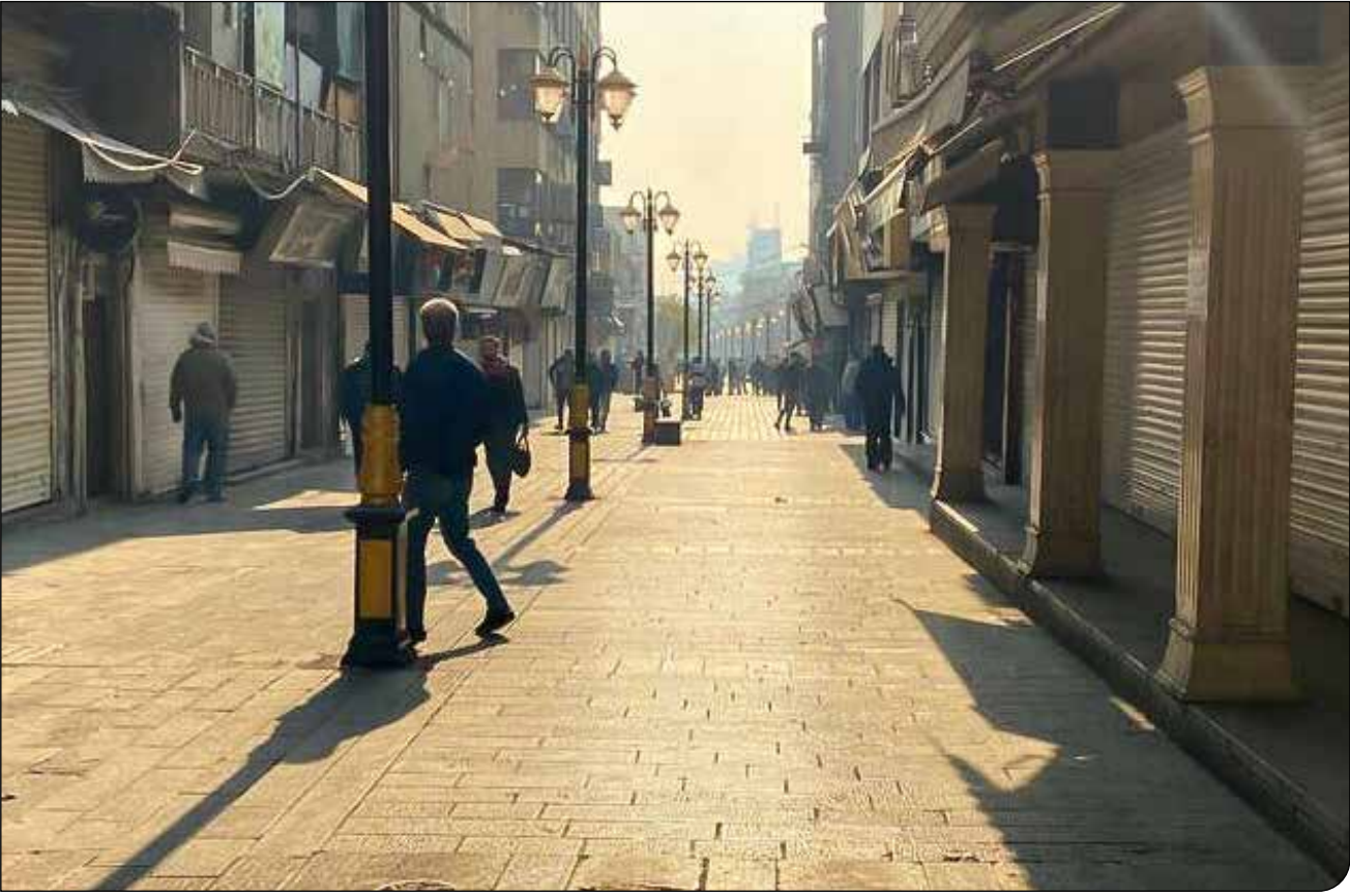
ایسنا | ۹۶

اپیام ما بعد از گذشت بیش از دو هفته از اعتراضات و اوج گرفتن آن در پنجشنبه و جمعه، ۱۸ و ۱۹ دی، خبرگزاری‌های داخلی روزهای شنبه و یکشنبه، ۲۰ و ۲۱ دی را آرام‌تر گزارش کردند. هنوز آمار دقیقی از کشته‌ها و آسیب‌دیدگان این اعتراضات وجود ندارد. هرچند خبرگزاری‌های داخلی پیرامون کشته‌شدگان نیروهای امنیتی گزارش‌های متعددی نوشتند: «تاکنون ۱۰۳ نفر از نیروهای سپاه، بسیج و فرجا در کشور به شهادت رسیده‌اند.» آمار دیگری که وجود دارد، خسارتی است که به خانه‌ها و اموال عمومی مانند مساجد، ایستگاه‌ها و ماشین‌های آتش‌نشانی و بانک‌ها در شهرهای مختلف وارد شده. در این گزارش سعی شده جمع‌بندی‌ای از اتفاقات اخیر ارائه شود.