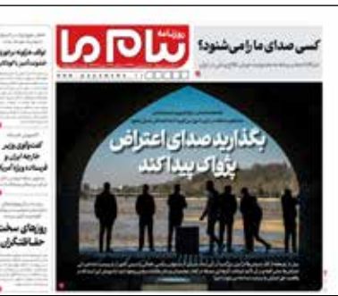
پیام ما دیروز ۱

معاون سلامت اجتماعی سازمان بهزیستی ادامه داد: «در مواردی شرایطی وجود دارد که نیاز به مداخله و مراجعه حضوری است و اورژانس اجتماعی با شماره ۱۲۳ به‌صورت شبانه‌روزی خدمات می‌دهد و رایگان است؛ به اقتضای