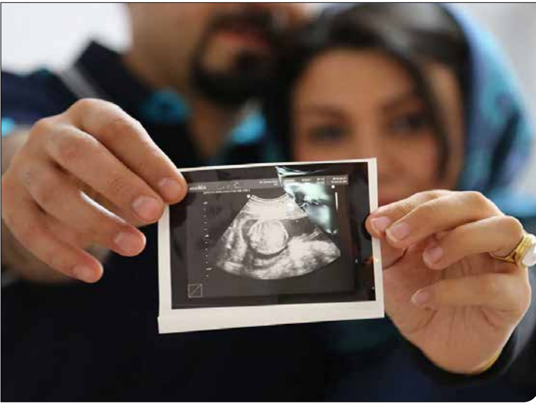
| باشگاه خبرنگاران جوان |