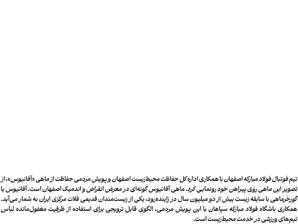
تیم فوتبال فولاد مبارکه اصفهان با همکاری اداره کل حفاظت محیط‌زیست اصفهان و پویش مردمی حفاظت از ماهی «آفانیوس»، از تصویر این ماهی روی پیراهن خود رونمایی کرد. ماهی آفانیوس گونه‌ای در معرض انقراض و اندمیک اصفهان است. آفانیوس یا گورخرماهی با سابقه زیست بیش از دو میلیون سال در زاینده‌رود، یکی از زیست‌مندان قدیمی فلات مرکزی ایران به شمار می‌آید.

همکاری باشگاه فولاد مبارکه سپاهان با این پویش مردمی، الگوی قابل ترویجی برای استفاده از ظرفیت مغفول‌مانده لباس تیم‌های ورزشی در خدمت محیط‌زیست است.