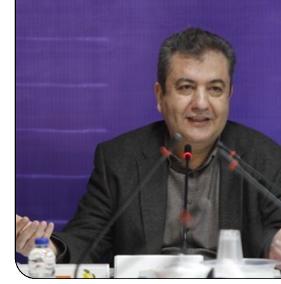
دکتر امیرحسین حسینی

معاون بهداشت دانشگاه علوم پزشکی شیراز با اشاره به اقدامات پیشگیرانه در حوزه بیماری‌های حاد تنفسی گفت: در راستای کاهش بروز و عوارض آفتلواتزا در فصل سرد سال، ۶ هزار دُز واکسن آفتلواتزا در میان گروه‌های هدف شامل سالمندان، بیماران مبتلا به بیماری‌های زمینه‌ای، زنان باردار، کودکان و کادر درمان در سطح استان توزیع و تریبک شده است. ایلامی با اشاره به نقش تعطیلی‌های مقطعی مدارس و دانشگاه‌ها در شکسته‌شدن چرخه انتقال گفت: کاهش تماس‌ها در این دوره‌ها موجب آفت انتقال ویروس‌های تنفسی می‌شود، اما با بازگشایی مراکز آموزشی، رعایت بهداشت فردی، استفاده از ماسک در فضاهای شلوغ، تهیه ماسک و پرهیز افراد دارای علائم از حضور در کلاس‌ها، نقش مهمی در کنترل بیماری دارد. این نشست با حضور اصحاب رسانه و مدیران ارشد معاونت بهداشت در سالن شهدای گنم دانشگاه علوم پزشکی شیراز برگزار شد.