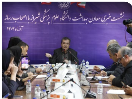
نشست خبری معاون بهداشت دانشگاه علوم پزشکی شیراز با اصحاب رسانه آذر ۲۰۲۴