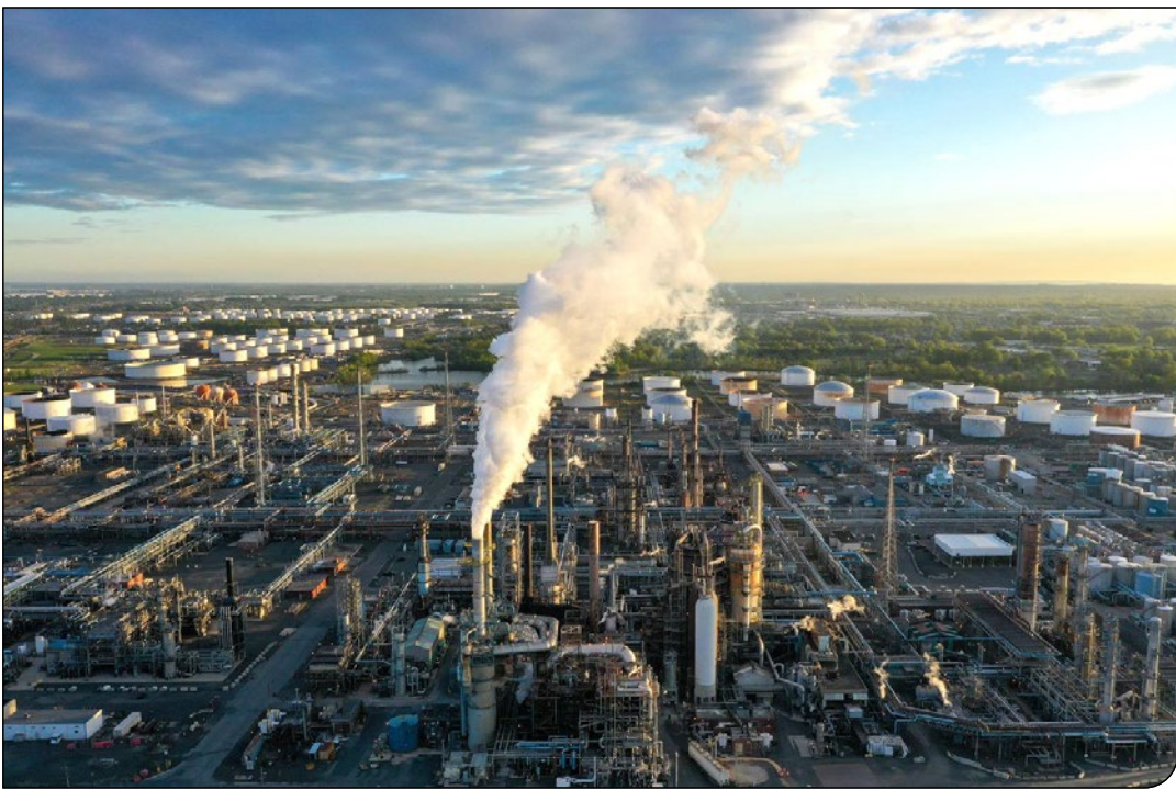
AP | ۱۶

انتشار گازهای گلخانه‌ای ۱۰ سال بعد از پیمان اقلیمی به کجا رسیده است؟