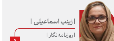
ازینب اسماعیلی روزنامه نگار