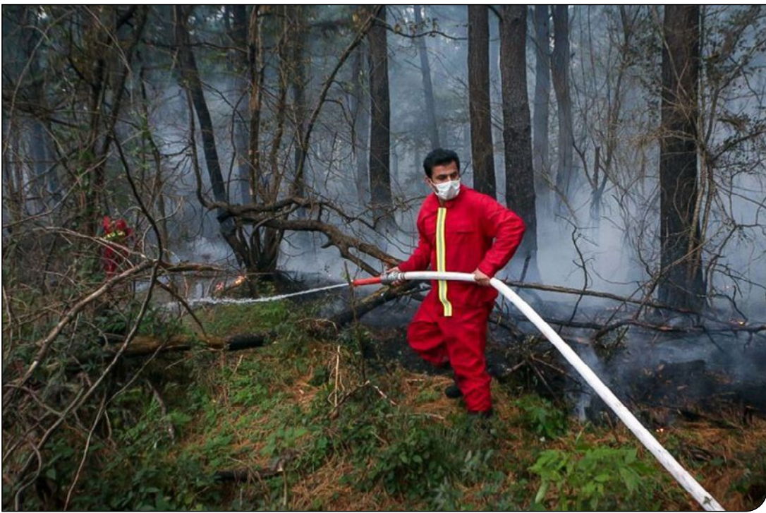
ایران | آریو

پاسخ سازمان حفاظت محیط‌زیست به اتهام «انفعال» در اطفای حریق جنگل‌های الیت