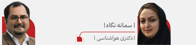
ا دکتری هواشناسی‌ا

از سال ۲۰۰۳ تاکنون شعارهای مختلفی برای نشان‌دادن اهمیت محیط‌زیست کوهستان و اهمیت حفاظت از آن و توجه عمومی برای روز جهانی کوهستان در نظر گرفته شده است. امسال نیز به رویه هر ساله، شعاری برای روز جهانی کوهستان در نظر گرفته شد: «یخچال‌های طبیعی برای آب، غذا و معیشت در کوه‌ها و فراتر از آن اهمیت دارند.» هرچند که در کشور ما برگزاری حداقل جشن یادبود این اتفاق، مایه خوشبختی است. نگاه ما به کوهستان ونحوه عملکرد و حفاظتمان نسبت به آن، نشان از این دارد که کوهستانی‌ترین کشور خاورمیانه و یکی از متاثرترین کشورهای جهان از کوهستان، تنها در روز جهانی کوهستان، آن‌هم به لطف چند سمن خاص یاد کوهستان می‌افتد.