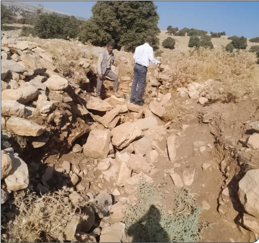
مردم از حفاری‌های غیرمجاز گسترده در اندیمشک

مردم از حفاری‌های غیرمجاز گسترده در اندیمشک شکایت دارند