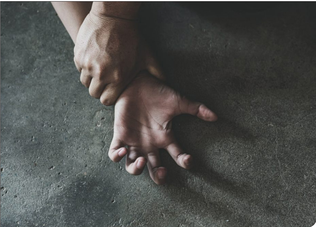
یک زن و یک مرد

«پیام ما» دلایل حمایت خانوادگی از متهمان به تجاوز را بررسی می‌کند