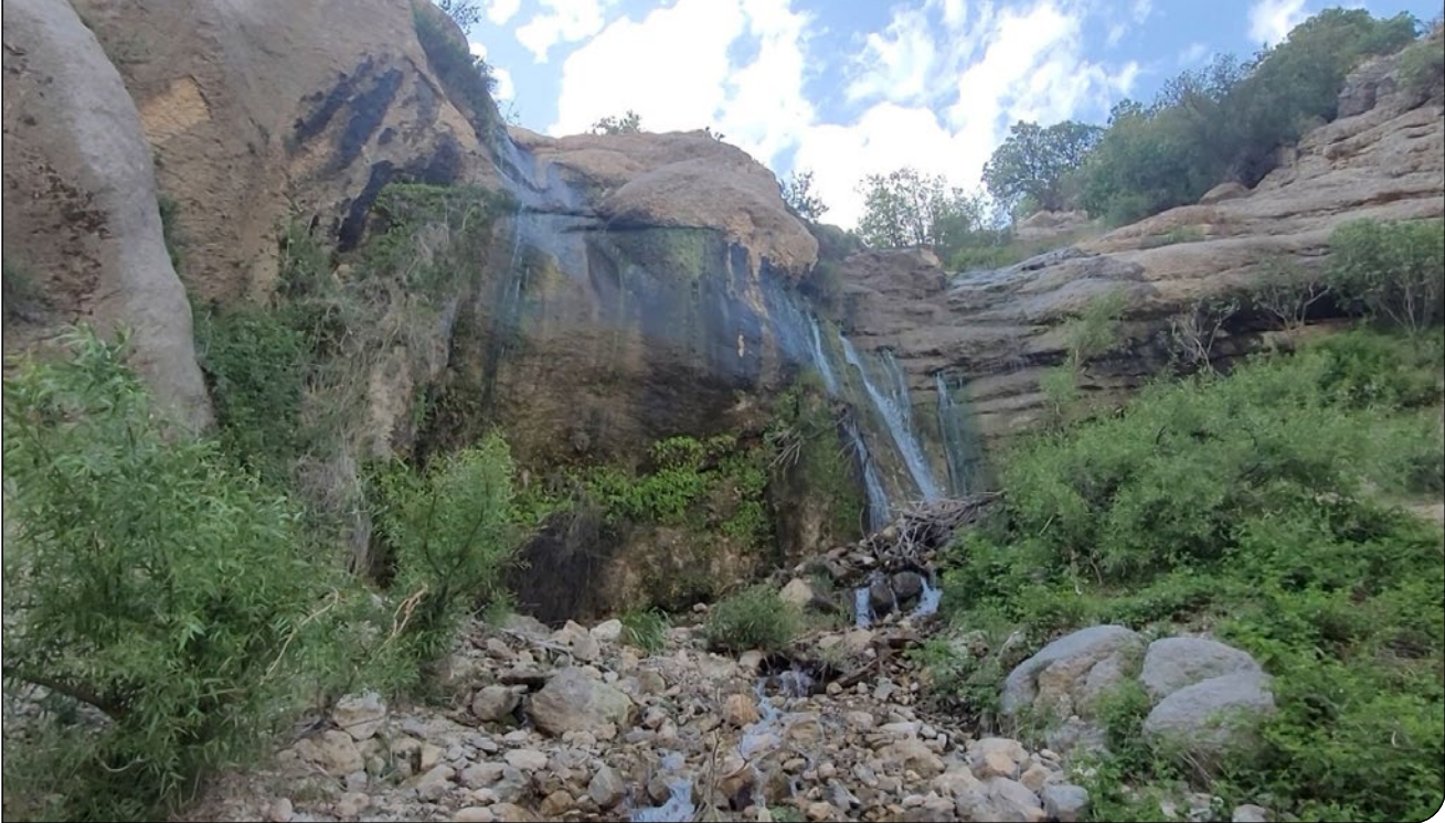
خیرگزارى صداوسپما | ۱۹

شنیده‌ها حاکی از آن است که این اقدام با چرغ سبز محیط‌زیست انجام می‌شود