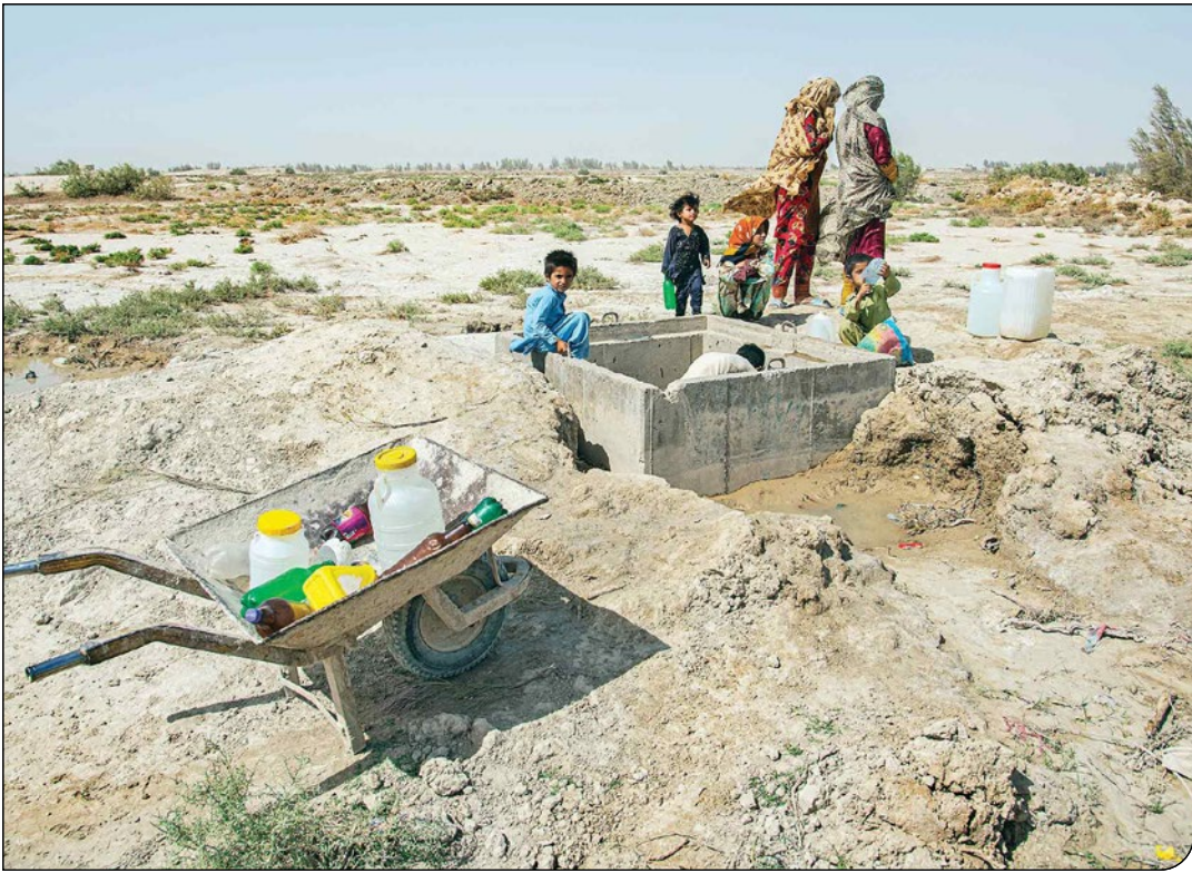
همشهری | ع.ا.

روایت اهالی «کیکسوج» که ۲۰ روز بی‌آب ماندند و صدایشان شنیده نشد