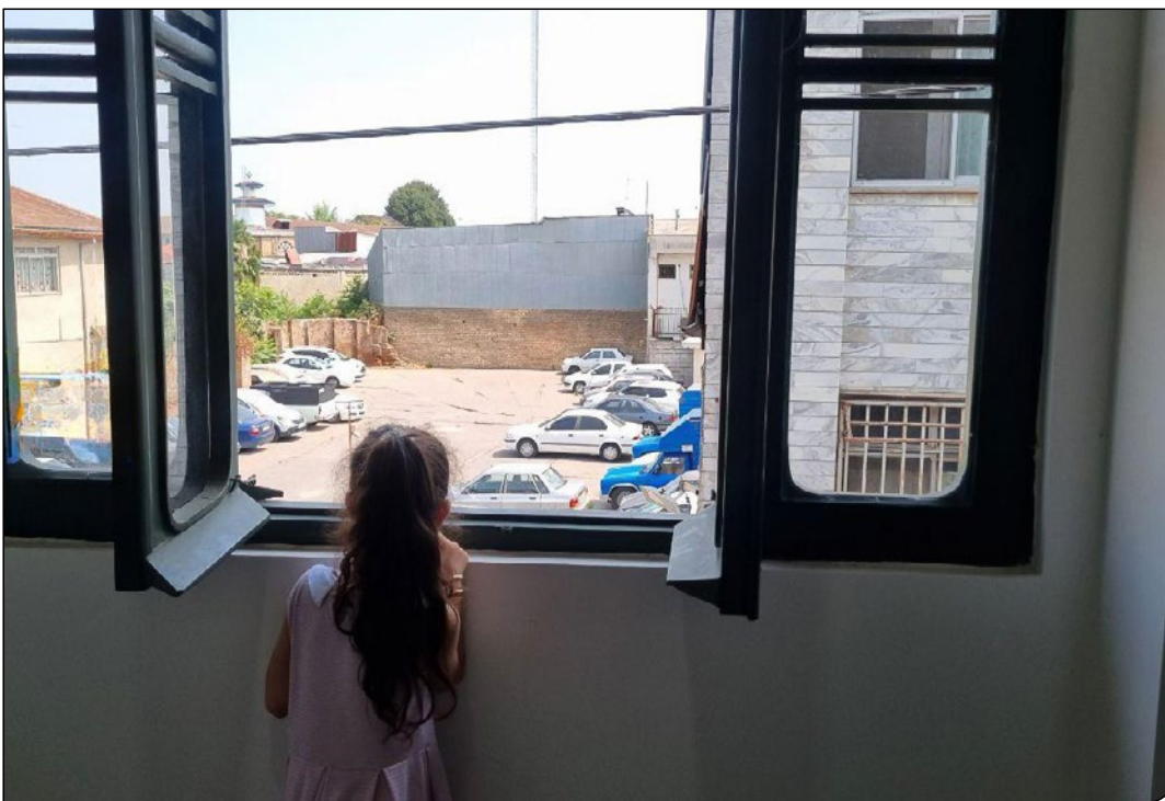
پارکینگ خودرو | ۹۰