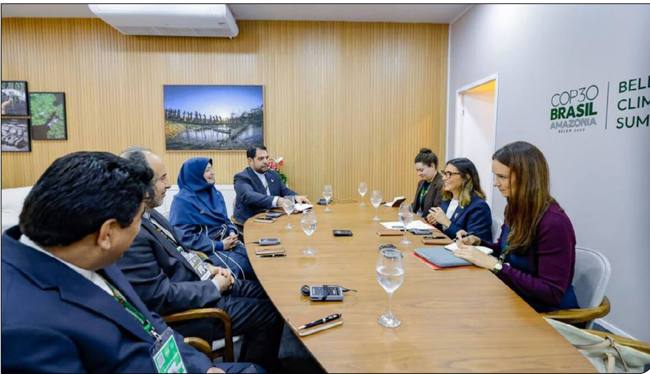
ایپام ما «شینا انصاری»، معاون رئیس‌جمهور و رئیس سازمان حفاظت محیط‌زیست که به‌منظور حضور در اجلاس جهانی تغییراقلیم (کاپ ۳۰) به کشور برزیل سفر کرده است در دیدار با برخی از مقامات حاضر در اجلاس بر اهمیت اقدامات مشترک محیط‌زیستی تأکید کرد.

انصاری در دیدار با «جنجا داسیلوا»، همسر رئیس‌جمهور برزیل، ضمن قدردانی از میزبانی دولت این کشور برای برگزاری اجلاس تغییراقلیم، به ظرفیت‌های گسترده همکاری‌های دوجانبه اشاره کرد و گفت: «روابط محیط‌زیستی می‌تواند در کنار سایر حوزه‌ها، تکمیل‌کننده زنجیره تعاملات سازنده میان دو کشور باشد.» او با تأکید بر نقش پررنگ زنان در حفاظت از محیط‌زیست، به ویژه در جوامع محلی، اهمیت توجه به دانش بومی را یادآور شد و با اشاره به چالش‌های ناشی از تغییراقلیم در مناطق طبیعی دو کشور، بر آمادگی ایران برای تبادل تجربیات و همکاری مشترک در این زمینه تأکید کرد. بانوی اول برزیل ضمن خوشامدگویی و ابراز خرسندی از حضور ایران در سطح عالی در اجلاس تغییراقلیم، بر