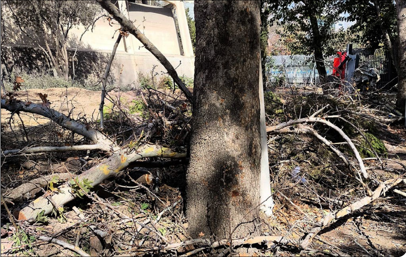
نمای نزدیک از تنه درخت خشک و شاخه‌های شکسته آن در موزه فرش تهران.