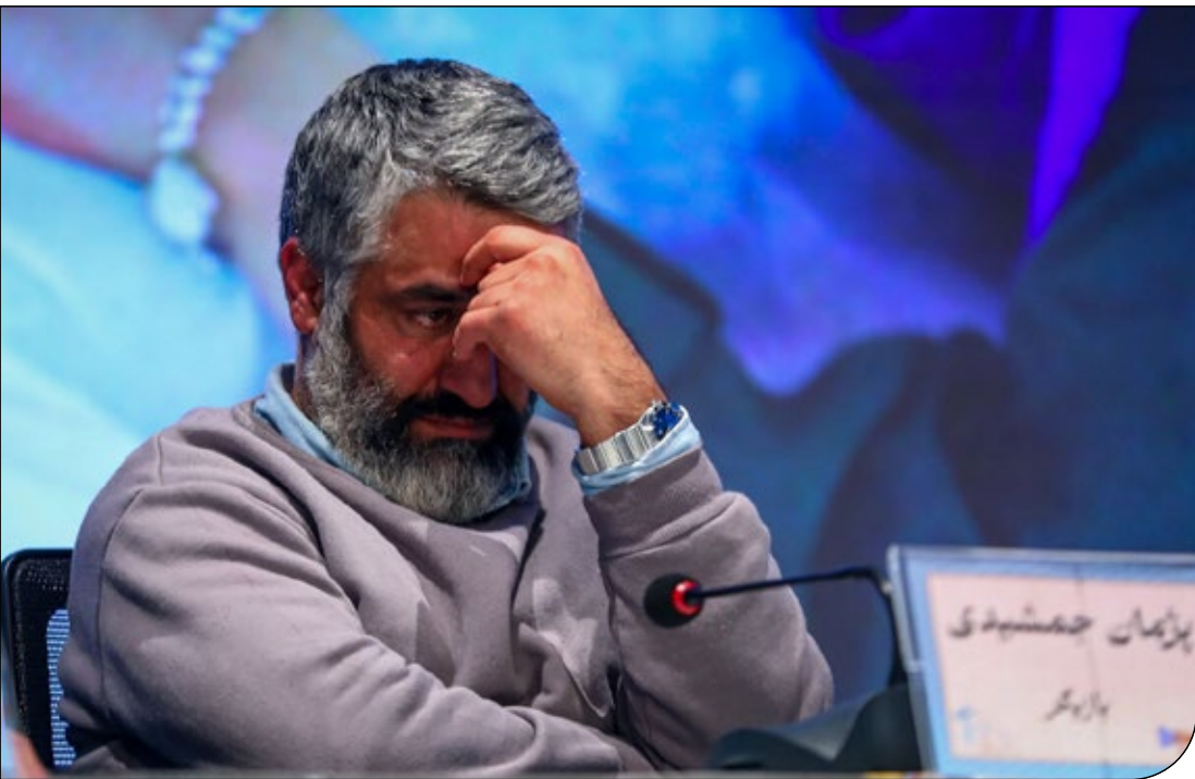
خبر آنلاین | ۱۴۰۱

هر حادثه‌ای با مرکزیت یک سلبریتی می‌تواند