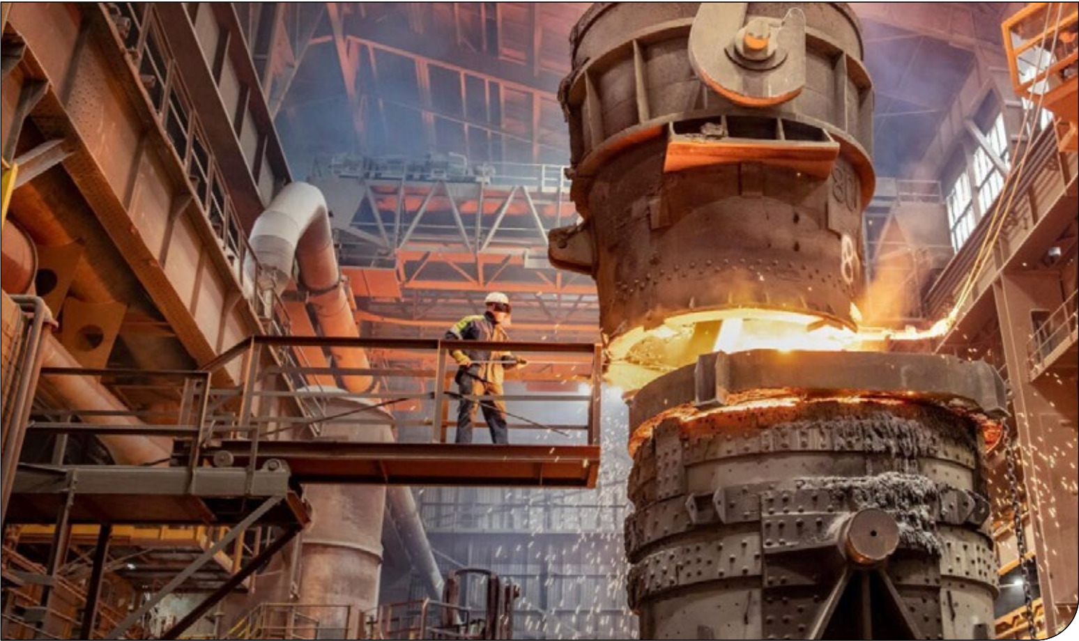
— ایسنا —

سخنگوی صنعت آب در پاسخ به این پرسش که آیا ممکن است در پاییز اسمال کاهش فشار آب در تهران ادامه داشته باشد، گفت: «ما در حال حاضر هم مدیریت فشار آب داریم و این روند ادامه دارد. بله، امکان کاهش فشار وجود دارد و این روال تا احیای شرایط آبی ادامه خواهد داشت.» بزرگ‌زاده درباره تدابیر در نظر گرفته‌شده برای سال آینده اظهار کرد: «در حال حاضر نصب سامانه‌های هوشمند که قابلیت مشاهده و کنترل از راه دور دارند، در دستورکار قرار گرفته است. همچنین، نصب ابزارهایی مانند حواله‌ها و کانه‌ده‌های مصرف نیز از برنامه‌های اصلی ما برای مدیریت هوشمند منابع آب است. این اقدامات می‌تواند نقش مهمی در کنترل مصرف و حفظ منابع آبی ایفا کند. امیدواریم با بهبود شرایط بارشی و همکاری مردم در مصرف بهینه، بتوانیم وضعیت منابع آبی را به‌سمت پایداری هدایت کنیم.» ایسنا