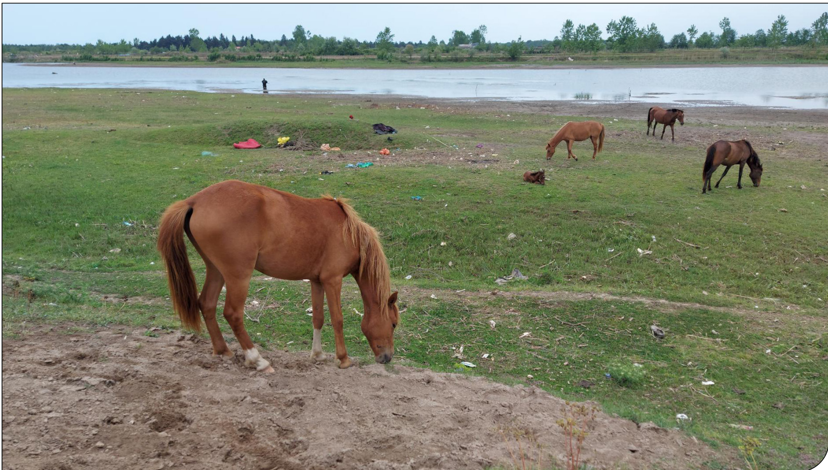
پارک ملی بوجاق

رئیس پارک ملی بوجاق: این زمین‌ها سند ندارد و با وجود اینکه در محدوده پارک ملی قرار گرفته‌اند، نمی‌توانند جزوی از املاک فردی به حساب بیایند