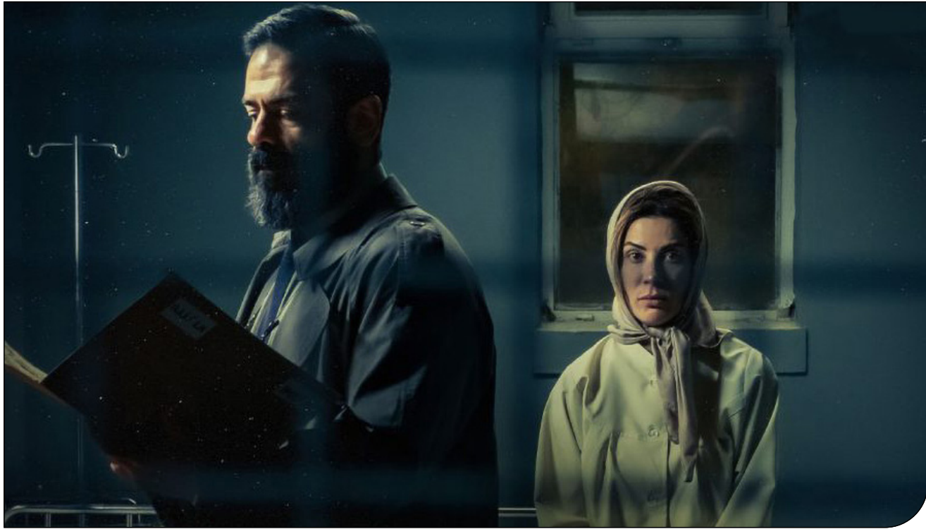
«پیمان سربال درونگه» | «انگ»

کارشناسان معتقدند بازنمایی منفی سلامت روان در رسانه ملی مانع درمان می‌شود