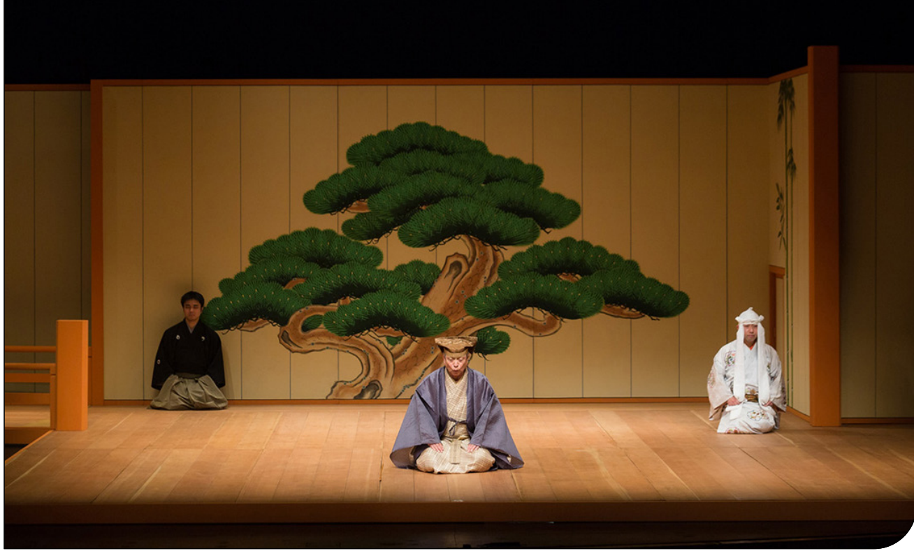
چگونه تئاتر ژاپن صحنه گفت‌وگوی سنت و مدرنیته شد