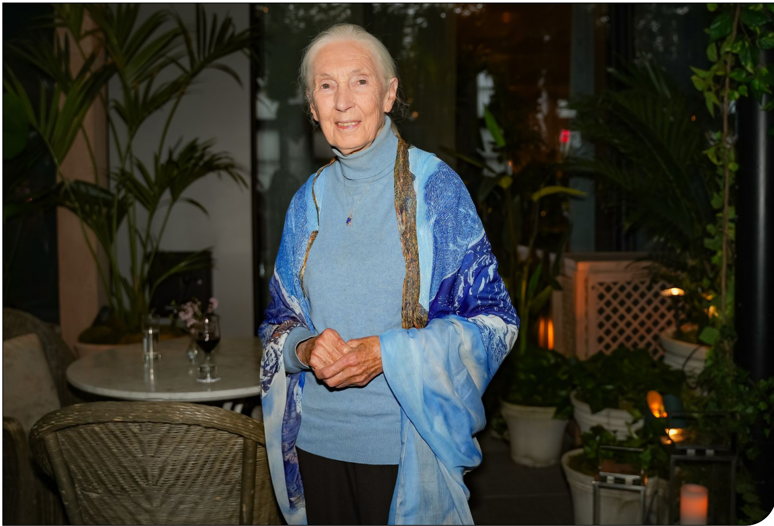
گفت‌وگویی منتشرنشده با «جین گودال» که عمرش را وقف روشن کردن گوشه‌های تاریک جهان کرد