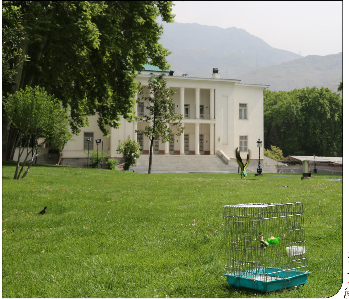
چطور موزه‌ها حافظ تنوع‌زیستی هستند؟

کنترل آفات با مامورهای باغ نگارستان «باغ‌موزه نگارستان» در میدان بهارستان قرار دارد؛ باقی که در نگاه اول نیلوفه‌های آبی آن جلب توجه می‌کند و بعد شاید خرابه‌ها گوشه‌وکنار آن در ذوق بیننده بزند. اما رکنی می‌گوید: «این خرابه‌ها برخلاف ظاهر عاری از حیاتشان، محل زیست و تکثیر عنکبوت و مارمولک‌هایی هستند که پایه زنجیره غذایی را تشکیل می‌دهند و آن را پایدار نگه می‌دارند. همین مدیریت مناسب که به مهم‌ترین جزئیات توجه