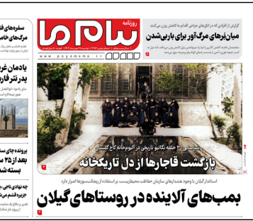
بمب‌های اکزیننده در روستاهای گیلان

شهری که فرد نابینا یا کمک چرخه‌های راهنمایی صوتی بتواند از خیابان عبور کند و به کمک گفپوش‌های مخصوص معابر، با استقلال کامل و براحتی رفت‌وآمد داشته باشد، بدون اینکه نگران برخورد با ستون‌های غیراستاندارد در پیاده‌رو باشد. کافی است یکبار سرفی به یکی از کشورهای همسایه، حتی نهندران توسعه‌یافته، داشته باشید تا از نزدیک شاهد حضور افراد دارای معلولیت در فضای شهری باشید.