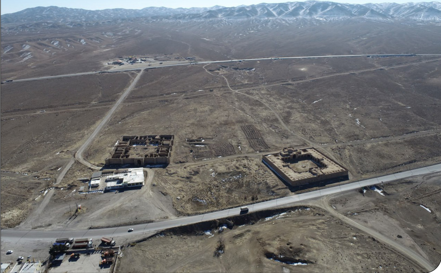
نمای هوایی از کاروانسرای ثبت جهانی آهوان

کاروانسراهای ثبت جهانی آهوان در سایه بی‌توجهی مسئولان، در معرض نابودی قرار دارند