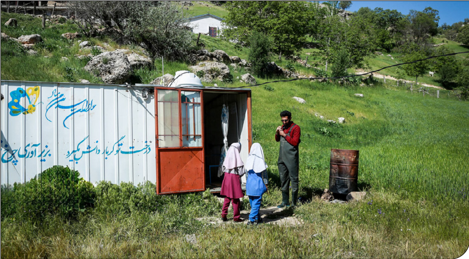
ایران — ۱۰۰

فعالان آموزشی با استناد به اصل ۳۰ قانون اساسی، خواستار رایگان شدن پیش‌دبستانی برای همه کودکان ایران شدند