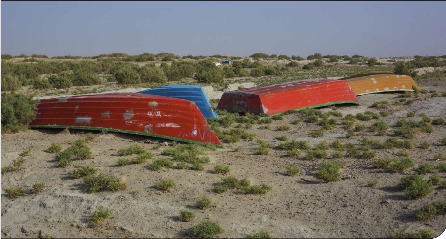
آنچه خشکسالی هامون بر سر تخت‌نشین‌ها آورد