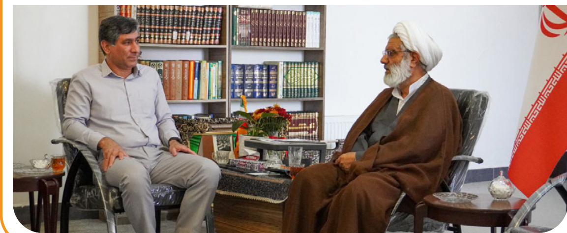
دیدار امام جمعه رفسنجان با مدیران مجتمع مس سرچشمه